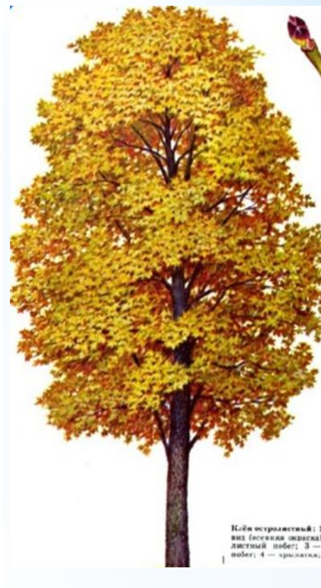
Клей остролиственный: 1 вид (осенняя окраска); лиственный побег; 3 — побег; 4 — шишечка.