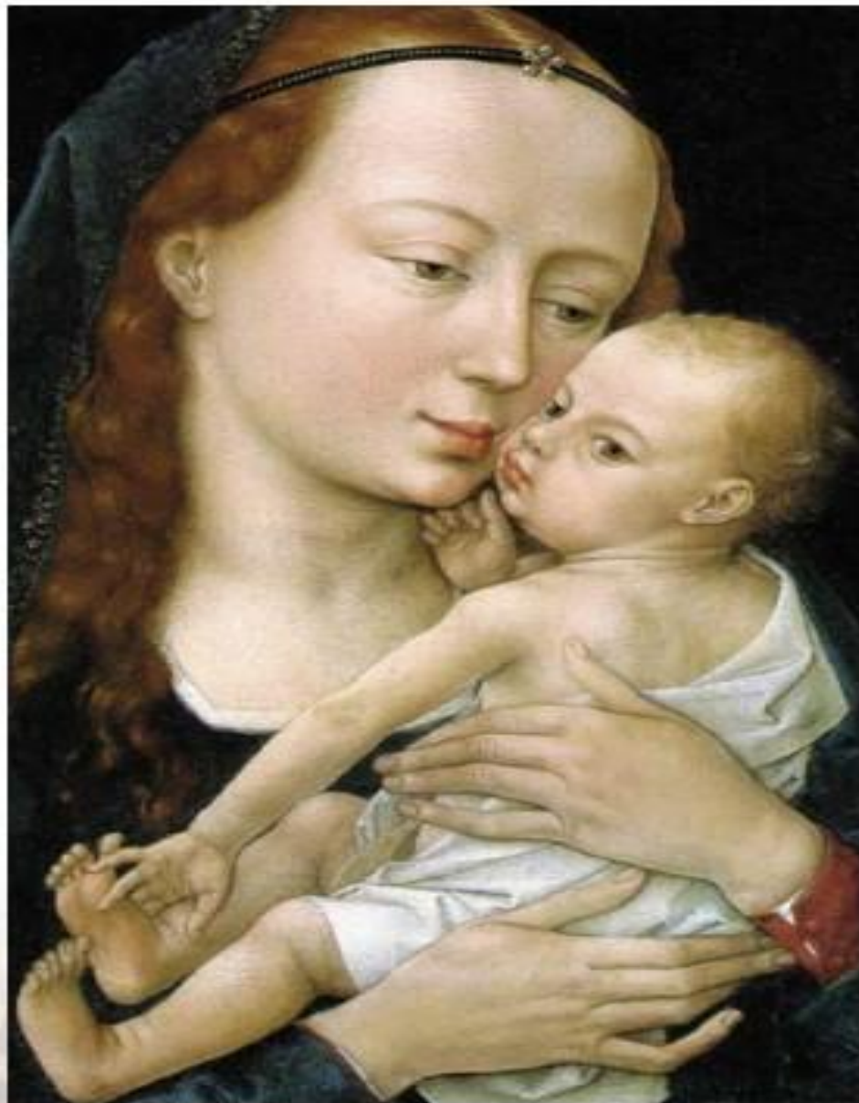
Р. ван дер Вейден. Мадонна с младенцем