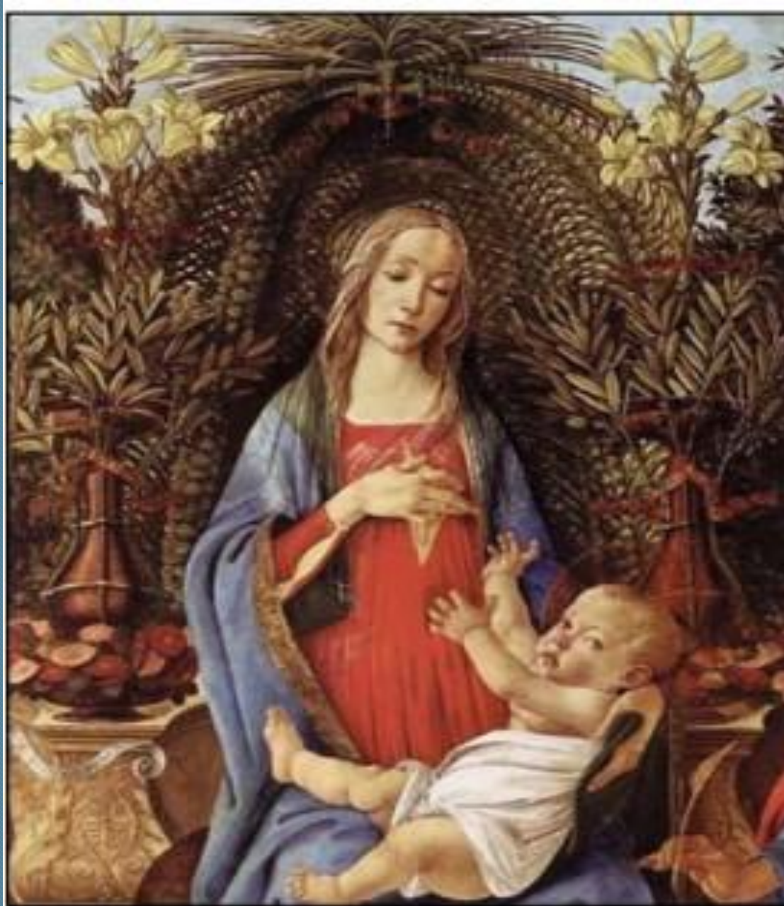
С. Боттичелли. Мадона с младенцем