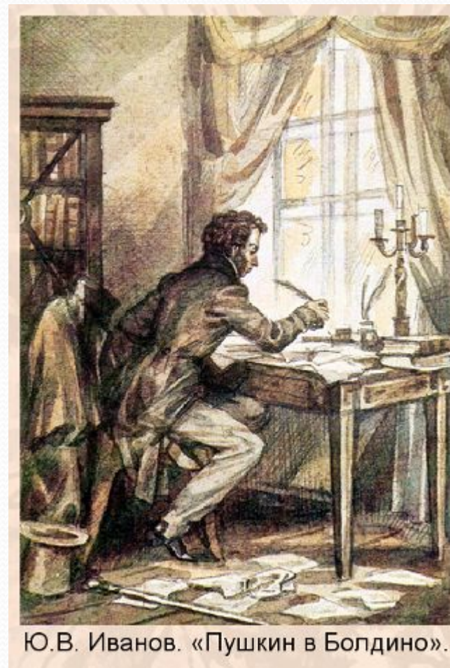
Ю.В. Иванов. «Пушкин в Болдино».

В письме П.А.Плетневу Пушкин сообщал, что привез «несколько драматических сцен, или маленьких трагедий».