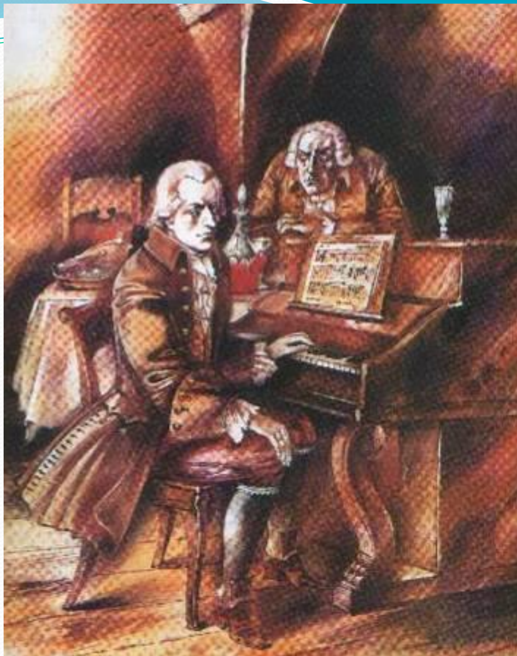
А.Борисов. Иллюстрация к трагедии «Моцарт и Сальери»