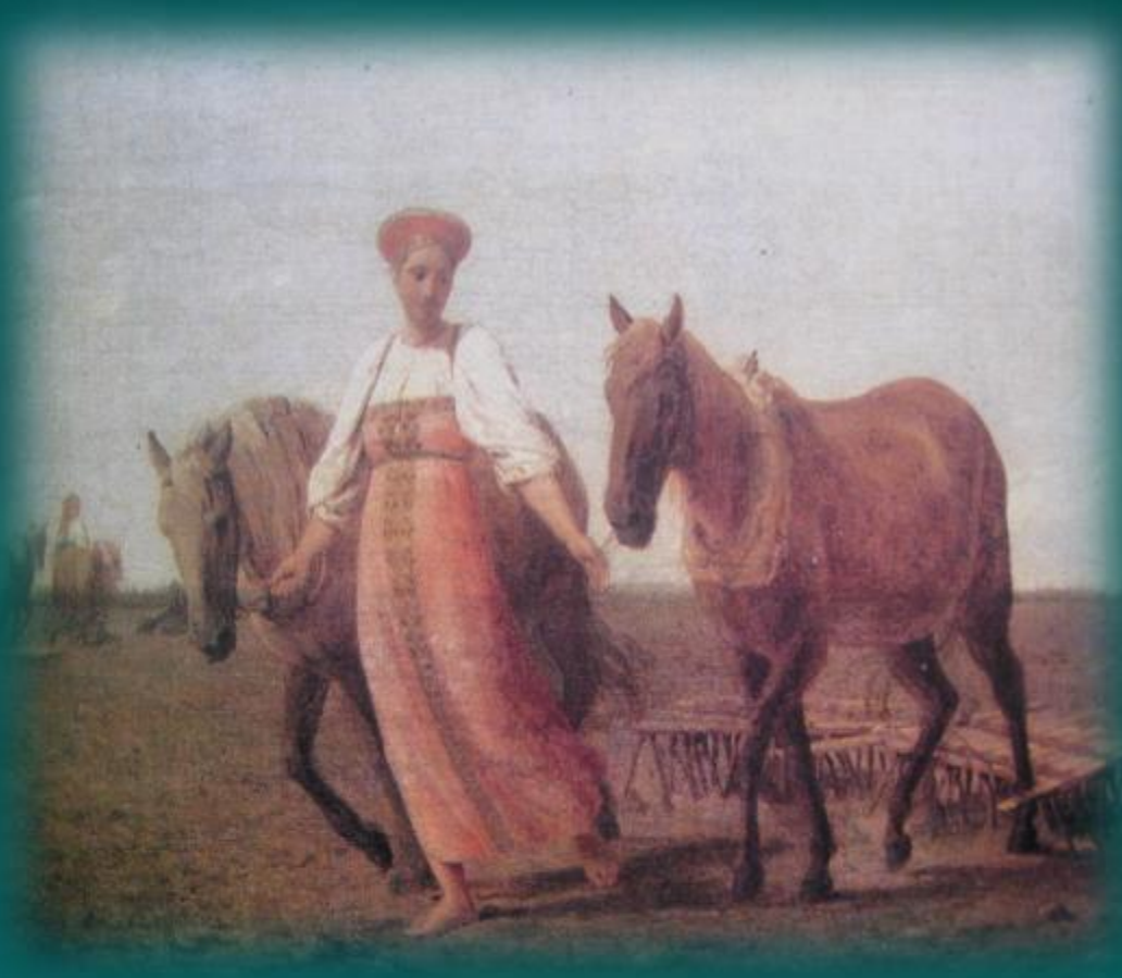
А.Г. Венецианов. На пашне.