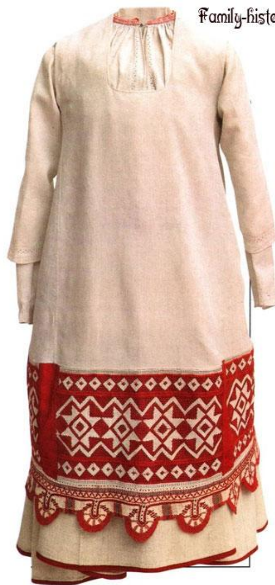
Девичий «печальный» костюм. Конец XIX — начало XX в. Тамбовская губерния