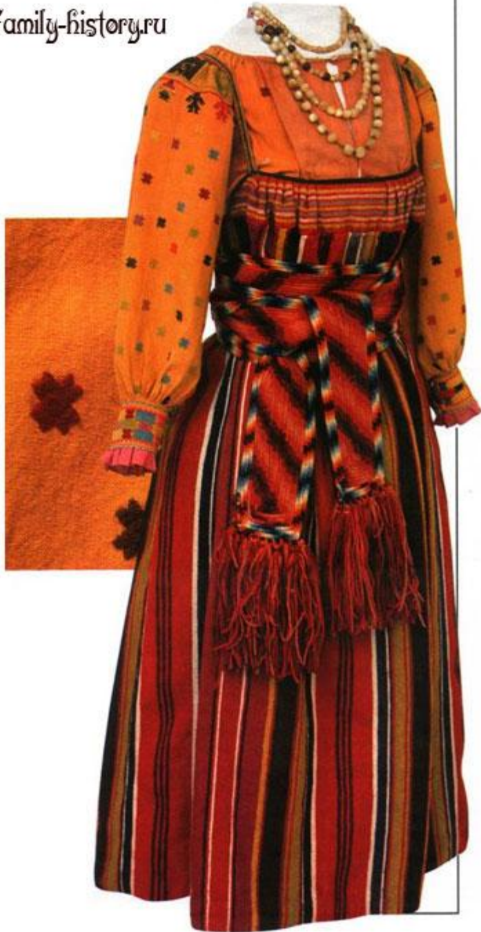
Костюм новобрачной. 1870-е гг. Вологодская губернии