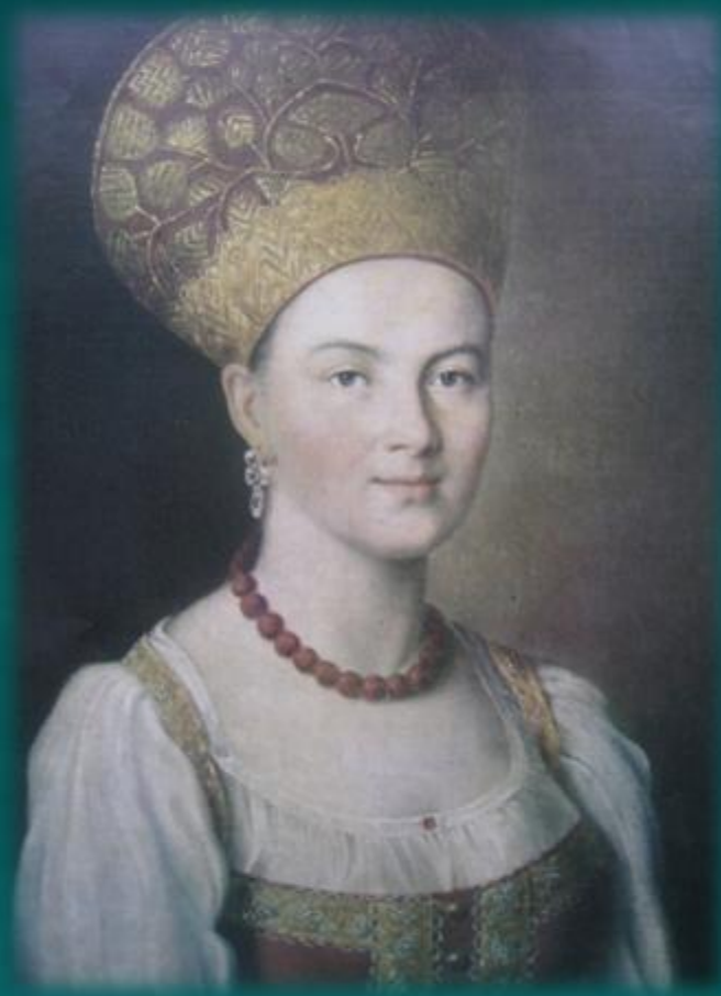
И.А. Аргунов. Портрет неизвестной крестьянки в кокошнике.