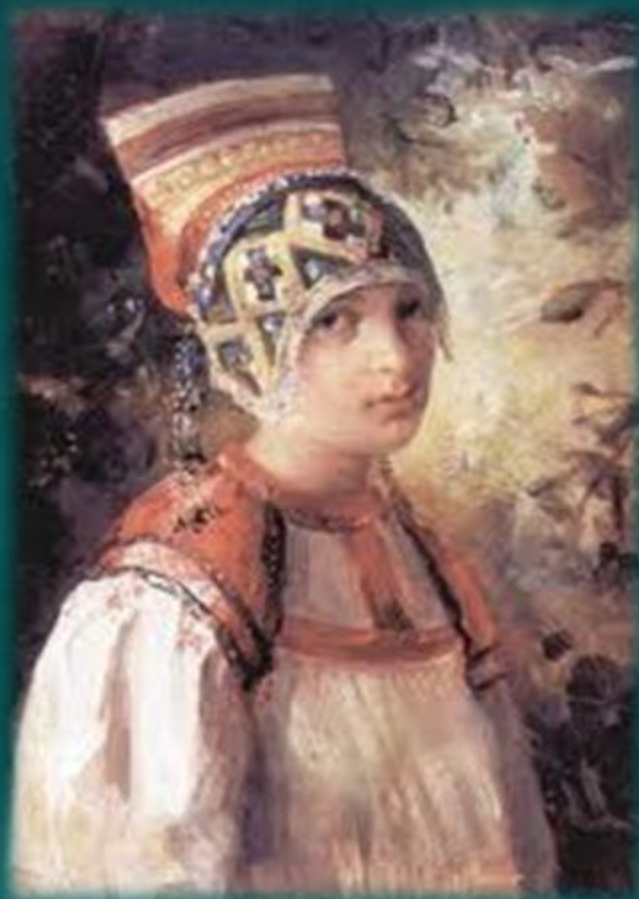
В.Е. Маковский. Крестьянка