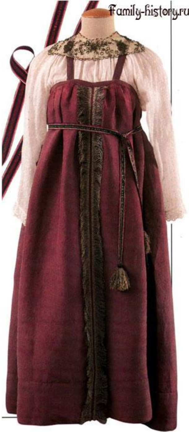
Женский свадебный костюм.