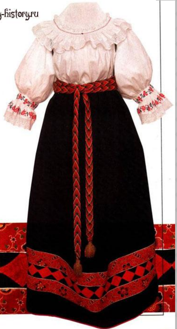
Девичий венчальный костюм. Начало XX в. Новгородская губернии