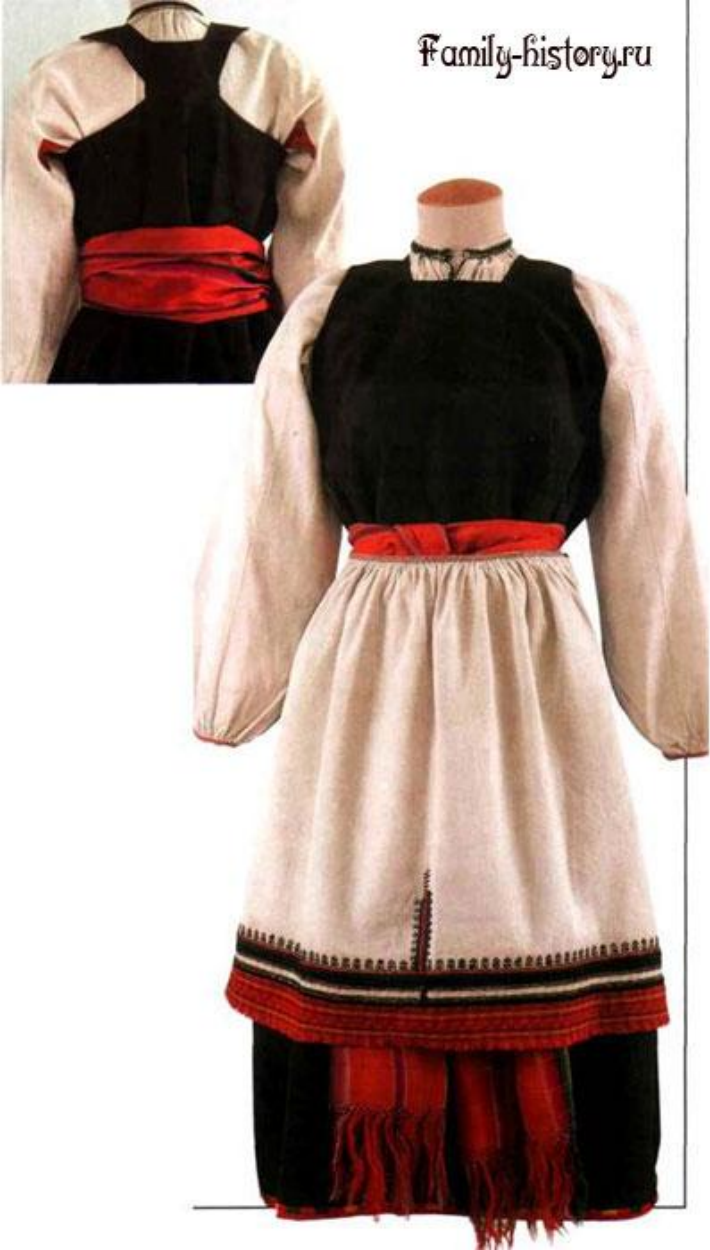
Девичьи венчальные костюмы.