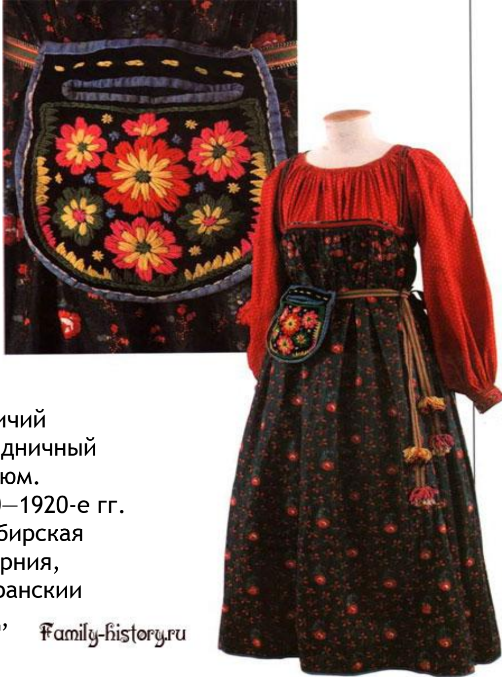
Девичий праздничный костюм. 1910—1920-е гг. Симбирская губерния, Сызранский уезд