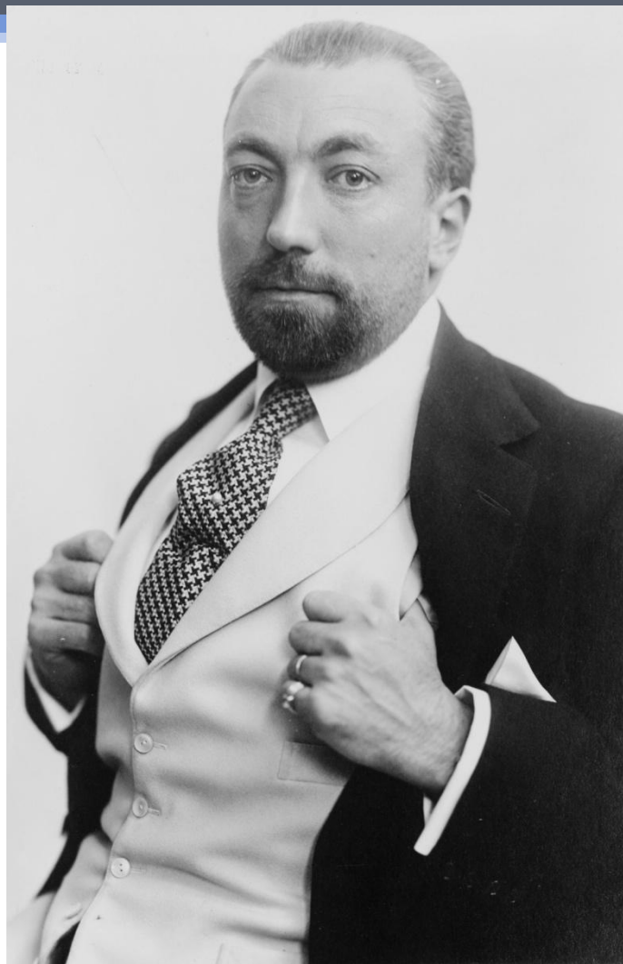
Поль Пуаре. (20.04.1879 — 30.04.1944.)