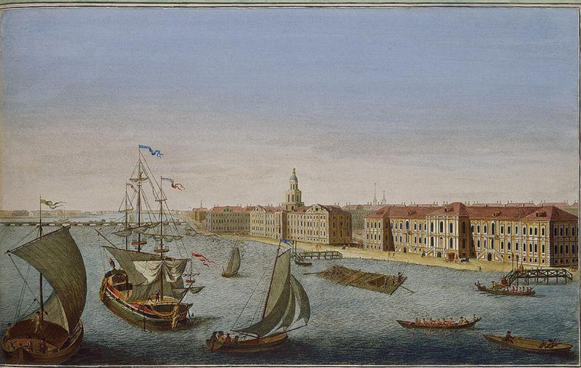
Vue des bords de la Neva en descendant la riviere entre le Palais d'hiver de Sa Majesté Imperiale & les batimens de l'Academie des Sciences