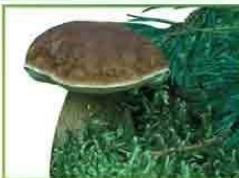
белый гриб (сосновый)