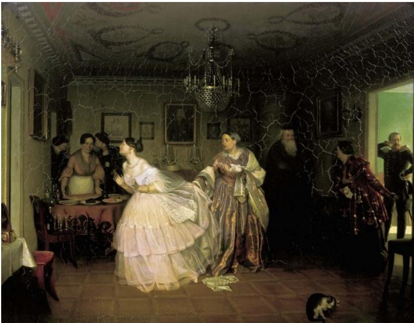
Федотов «Сватовство майора»