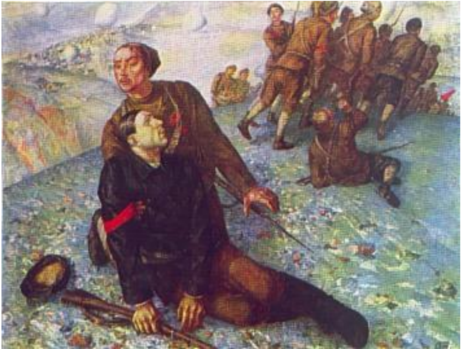
Петров –Водкин «Смерть комиссара»