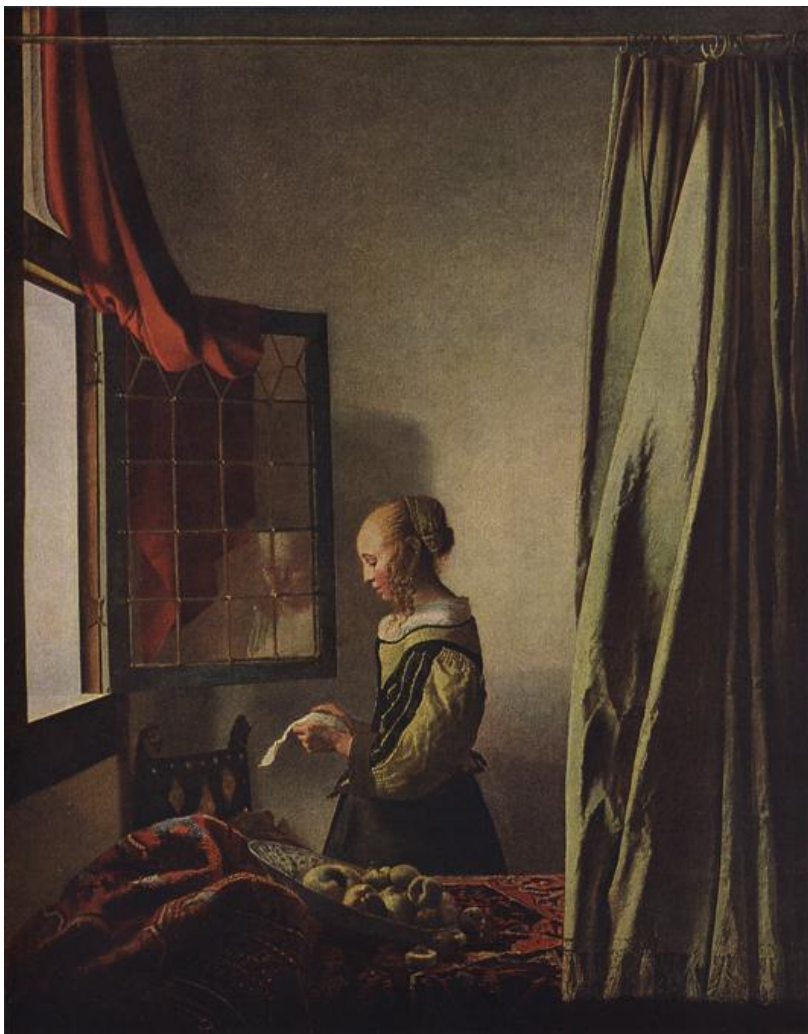
Ян Вермеер «Девушка с письмом»