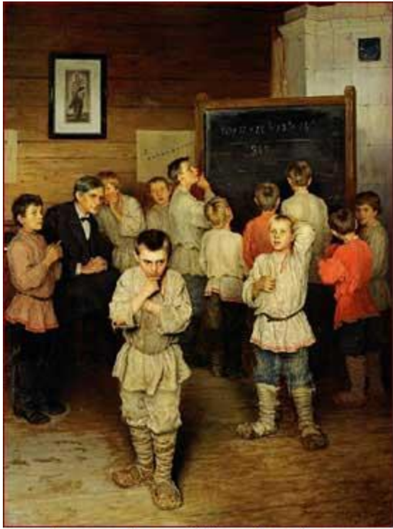
Богданов-Бельский "Устный счет".