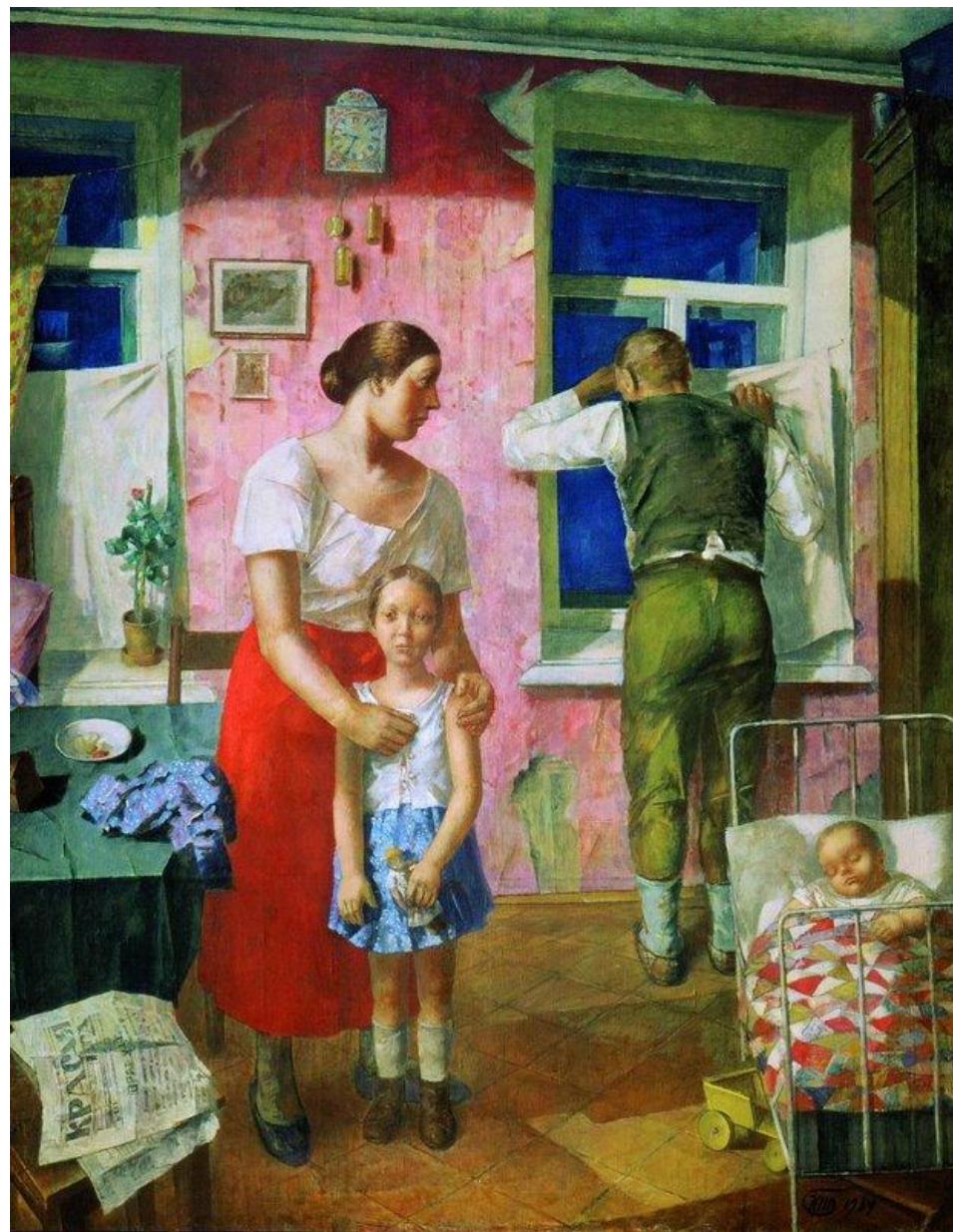
Петров- Водкин «Тревога»