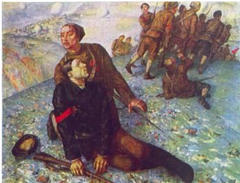
Петров –Водкин «Смерть комиссара»