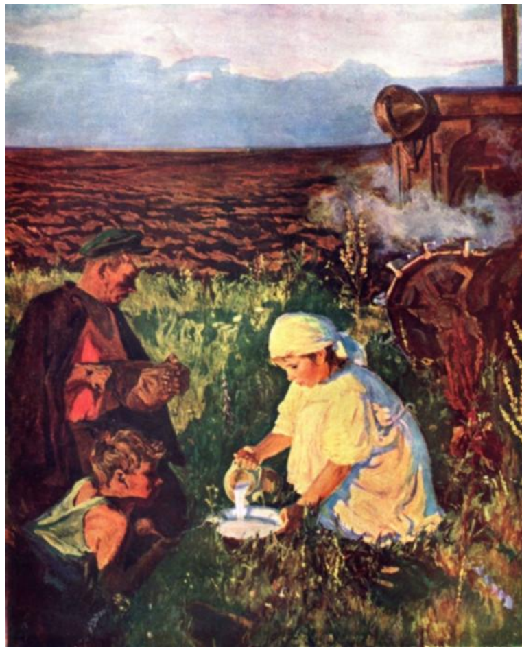
Пластов «Ужин тракториста»