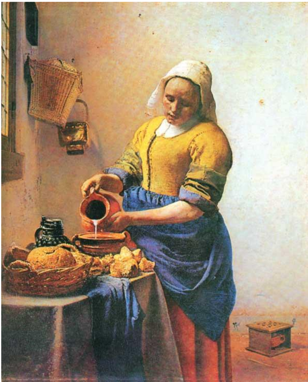
Ян Вермеер «Молочница»