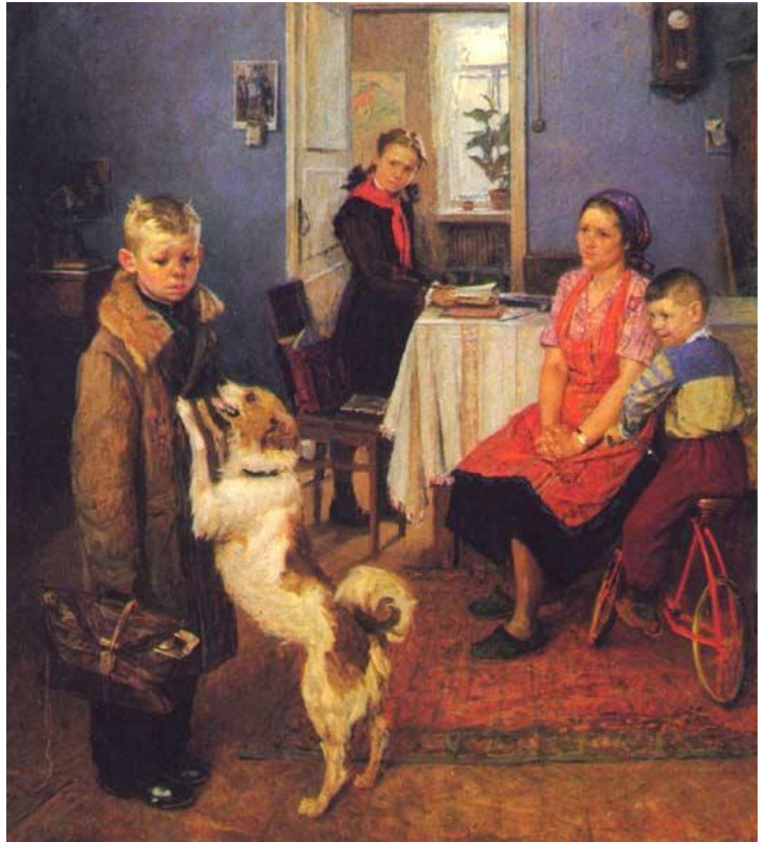
Решетников «Опять двойка»