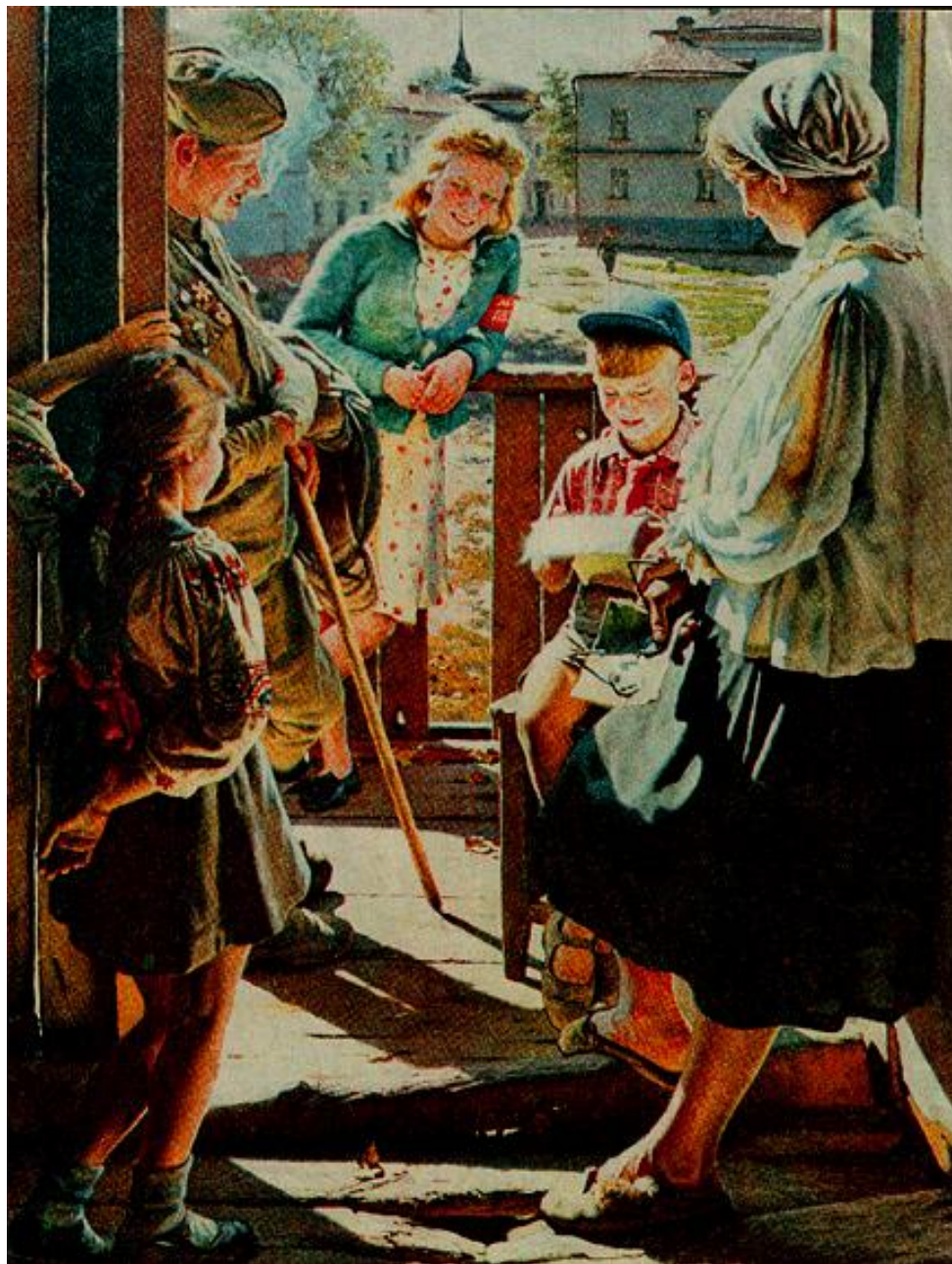
Лактионов «Письмо с фронта»