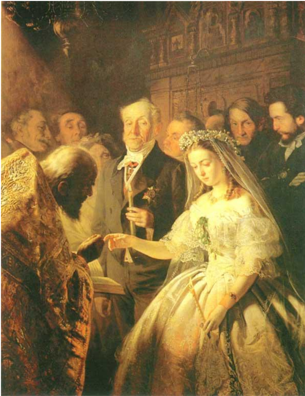
Пукирев «Неравный брак»