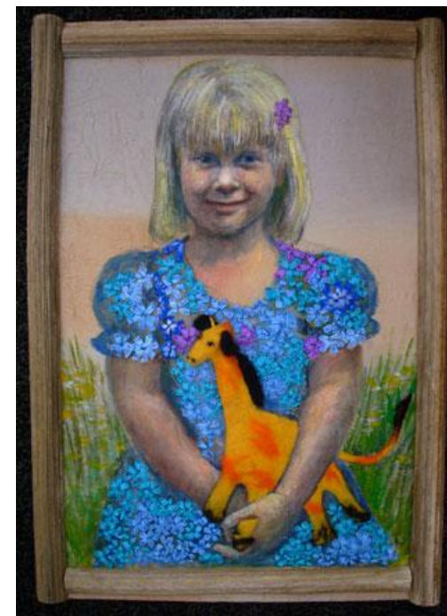
Худ. А. А. Резакова