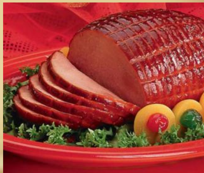
вЕтчина – старое мясо