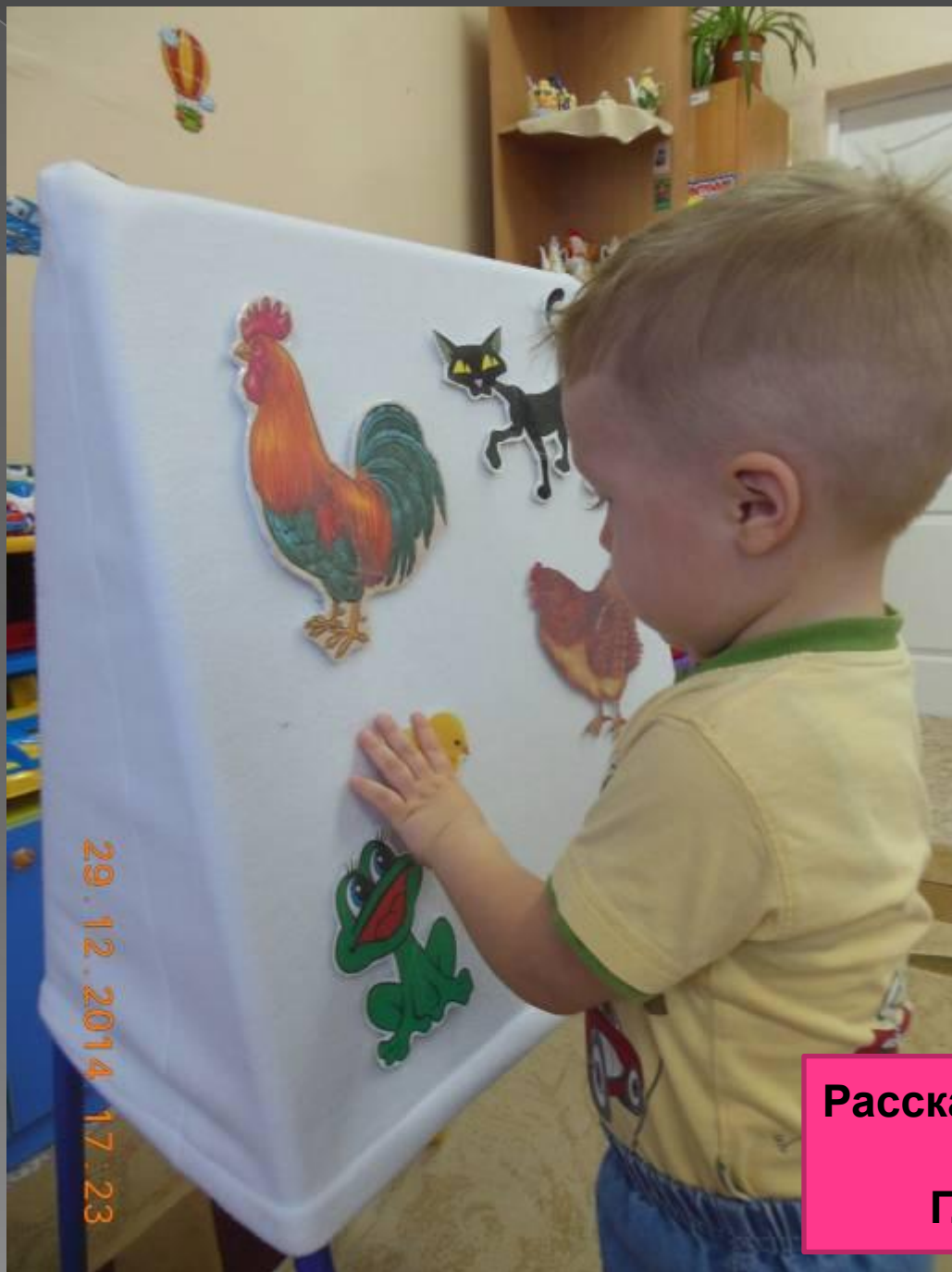
Рассказывание сказок с помощью фланелеграфа Г. Цыферов «Цыпленок»