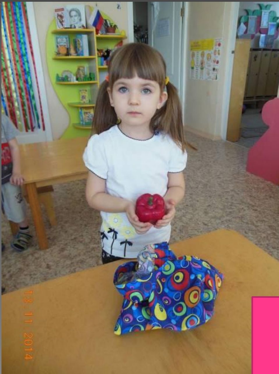
«Чудесный мешочек» (описание овощей)