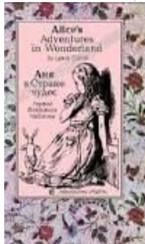
В. Набоков. Аня в стране чудес