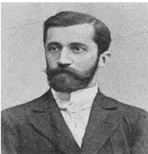
Дмитрий Сергеевич Мережковский.

Умер и похоронен во Франции, близ Парижа «Природа»