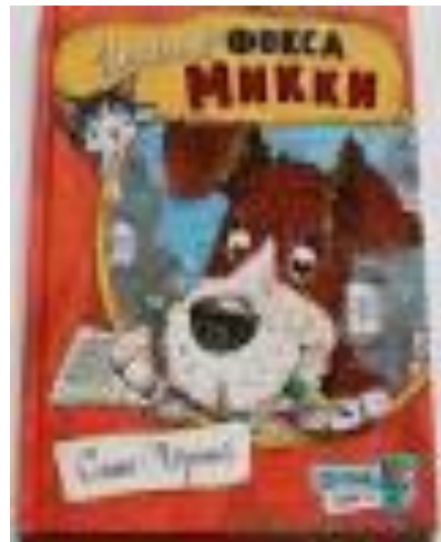
Саша Чёрный Дневник фокса Микки