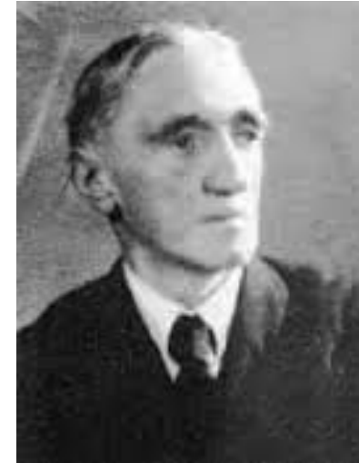
Иван Сергеевич Шмелёв. «Мартовская капель»

Умер во Франции, близ Парижа, прах перевезён в Москву.