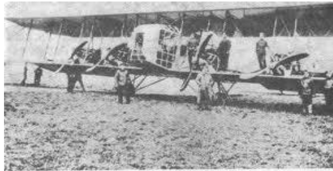
"Илья Муромец" Симферского, 1914 год.