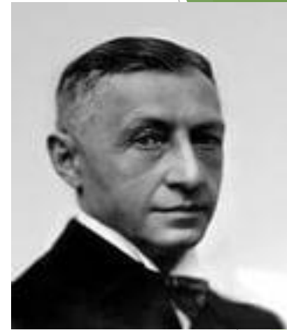
Иван Алексеевич Бунин «Детство».