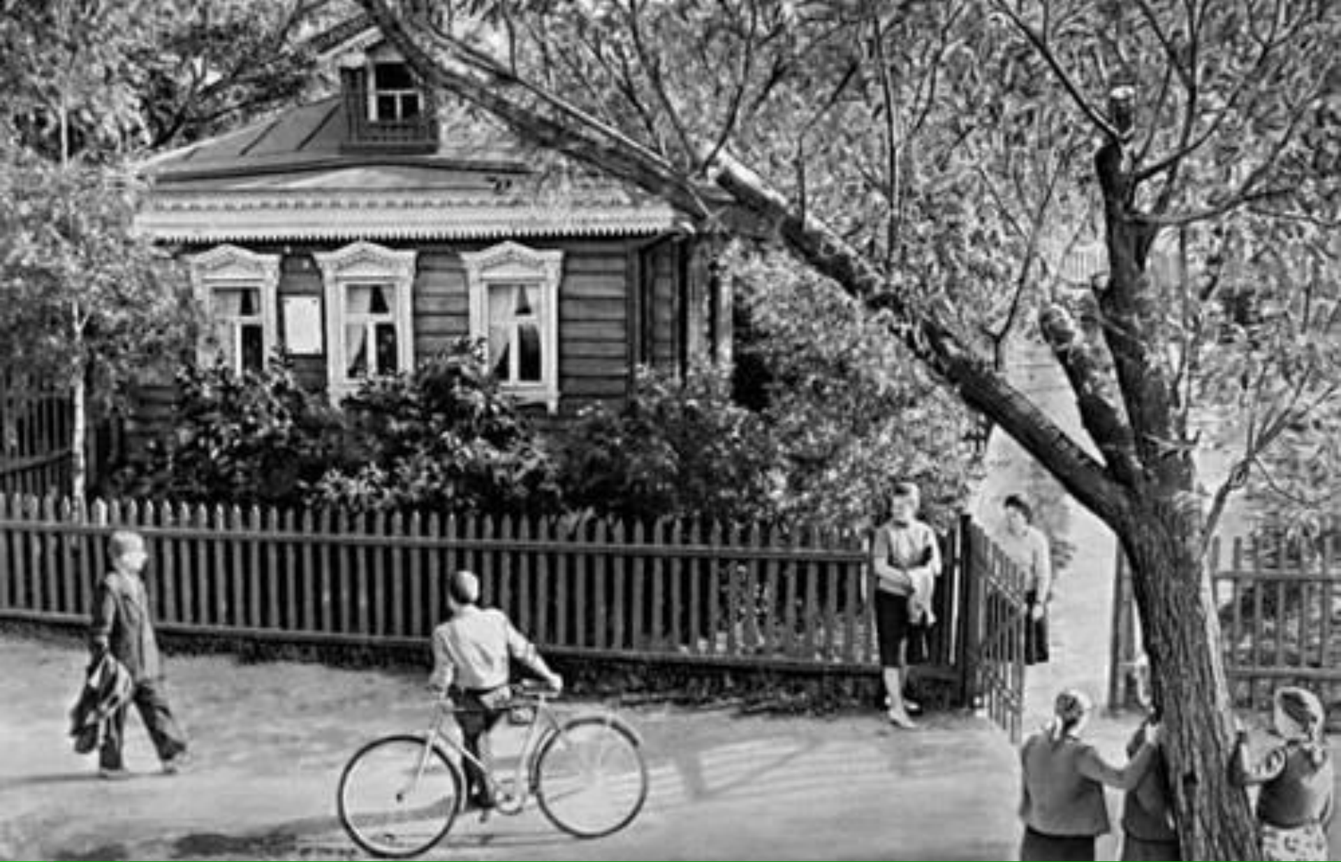
Дом-музей С.А.Есенина в селе Константиново