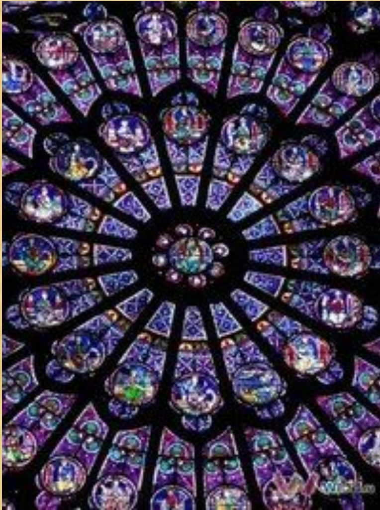
Собор парижской богородицы. Париж