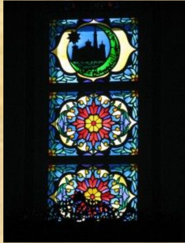
Витраж в мечети трёх сподвижников