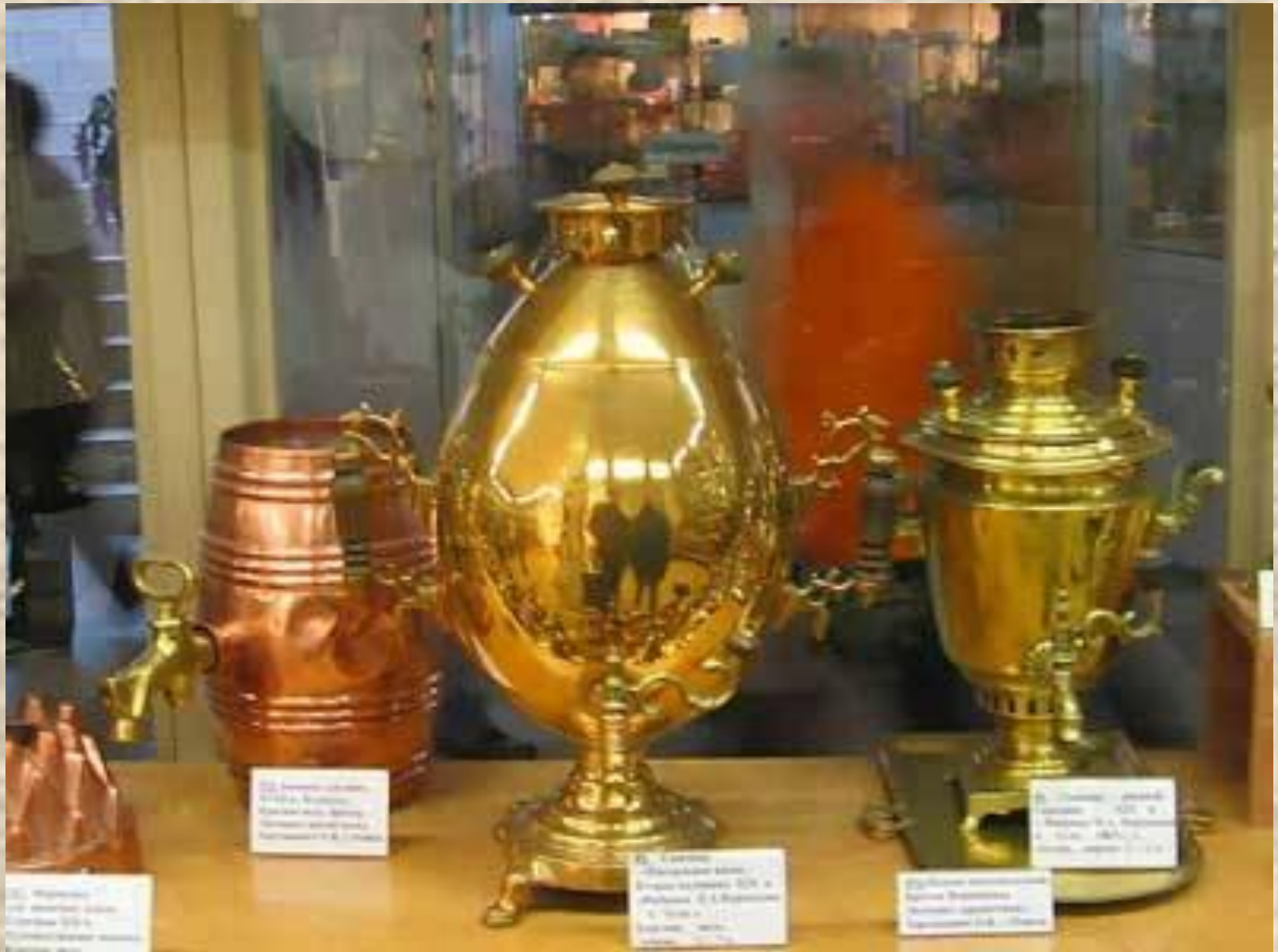
1. Самовар из алюминия 1910-15 гг. Музей-заповедник «Кремль»