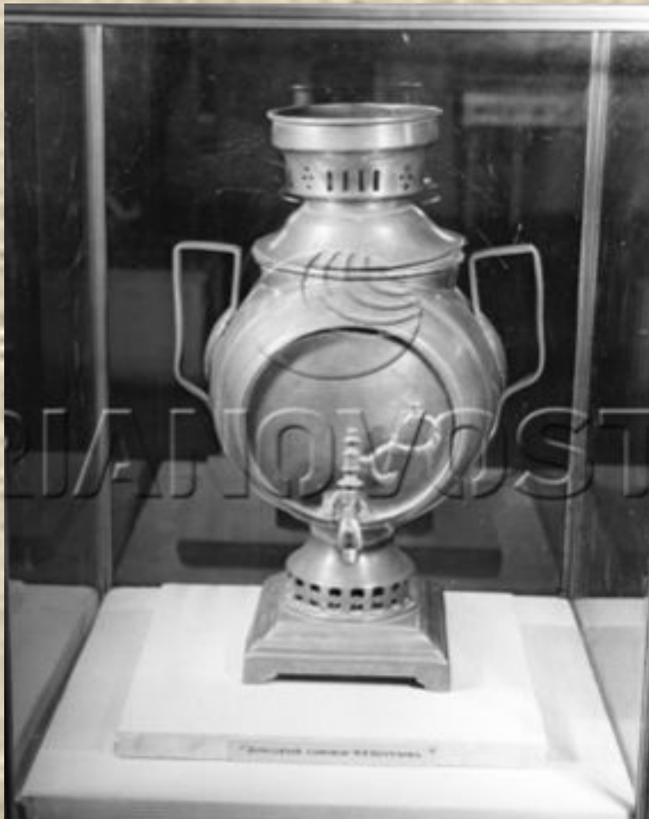
Самовар русского полководца М.И. Кутузова