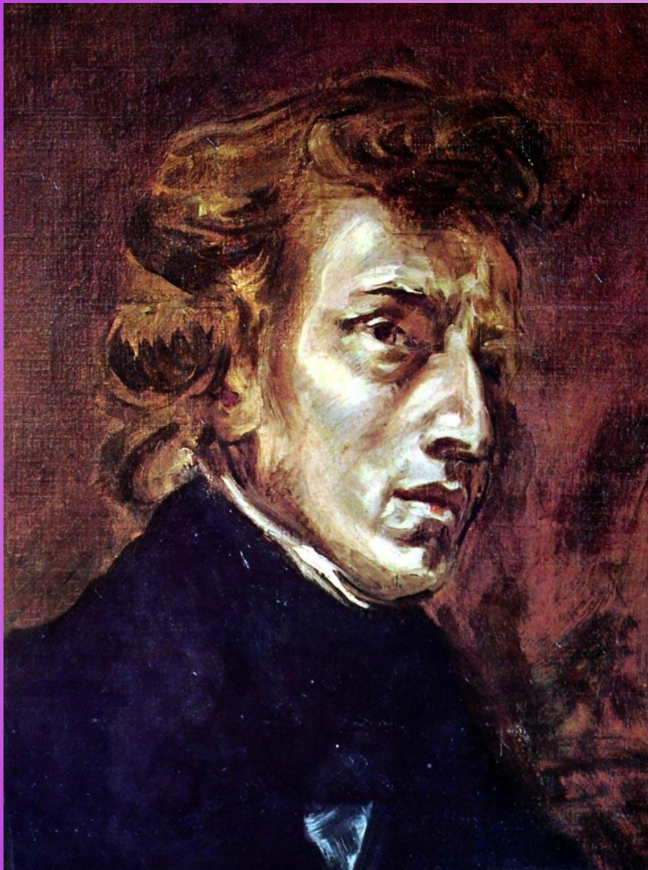
Ф. Шопен . Этюд № 12 («Революционный »)