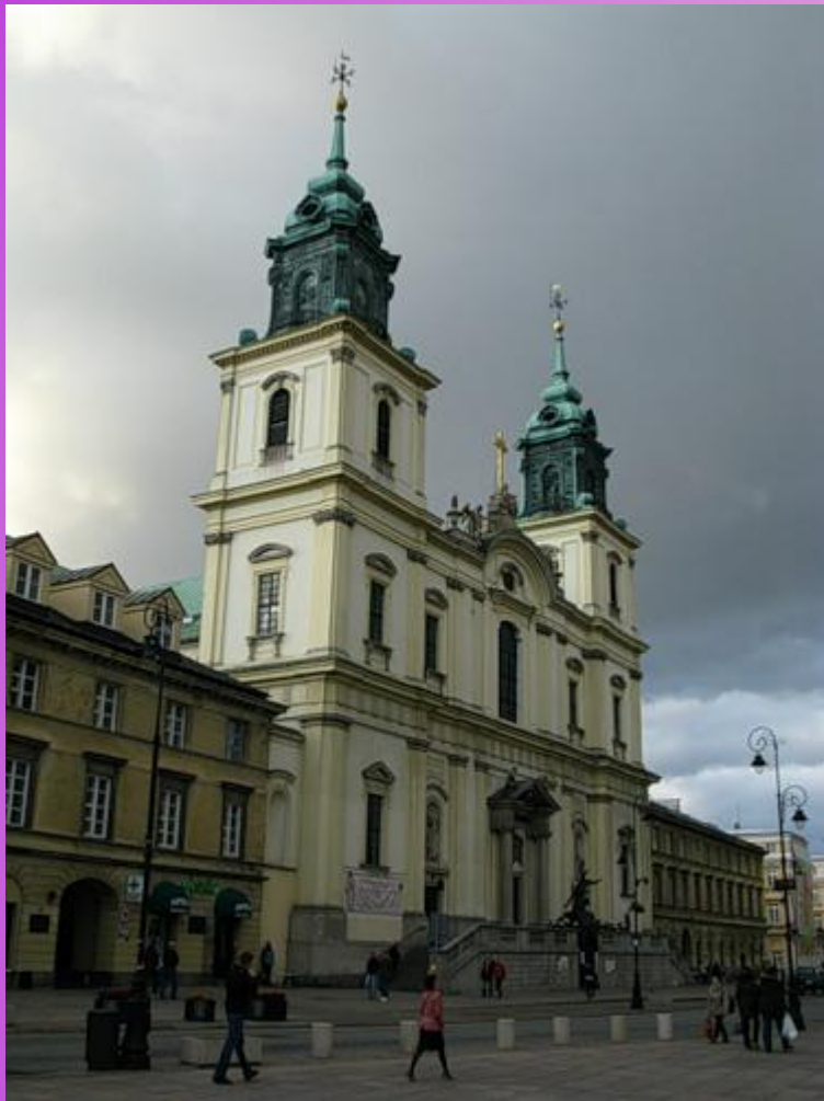
Костел Святого Креста в Варшаве