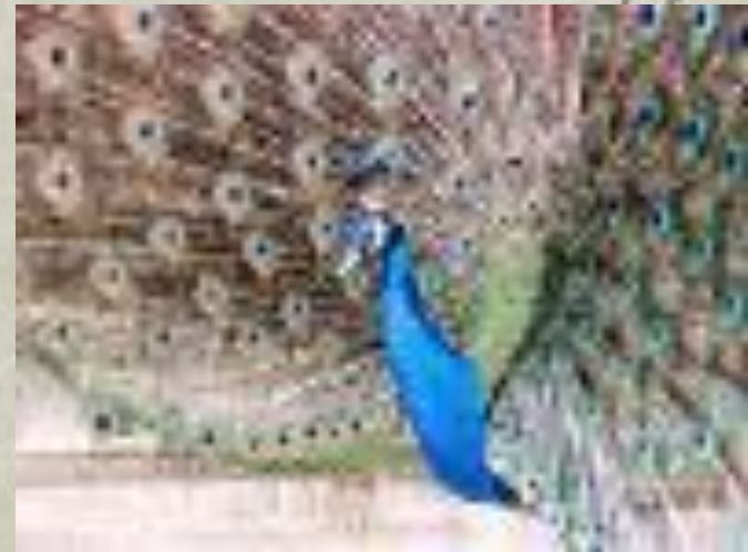
ПА В ЛИН