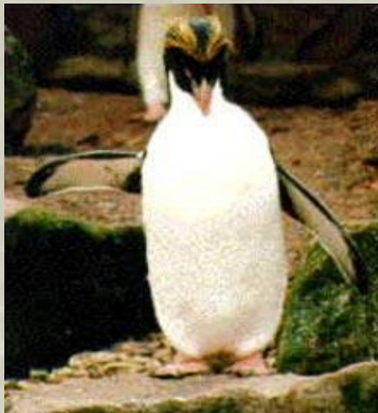
ПИНГ В ИН