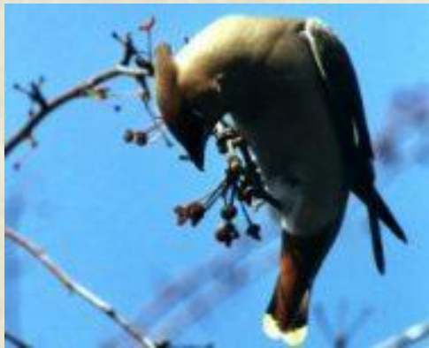
С В ИРИСТЕЛЬ