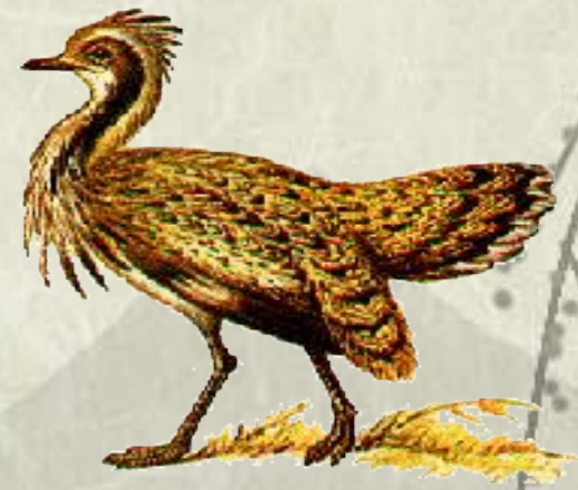
ДРО Ф А