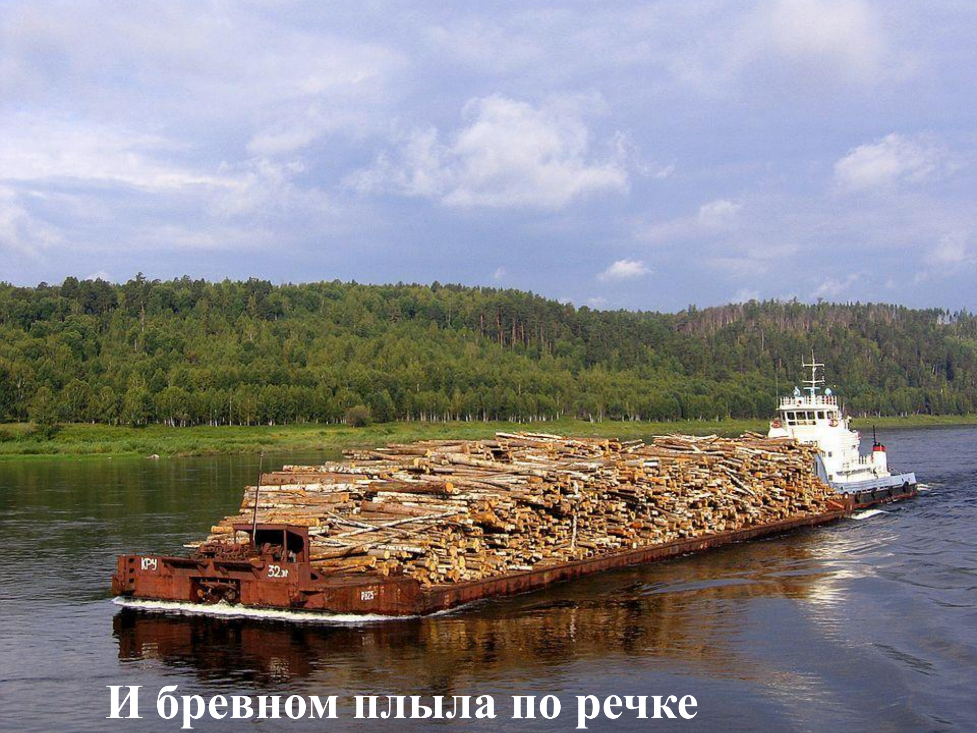
И бревном плыла по речке