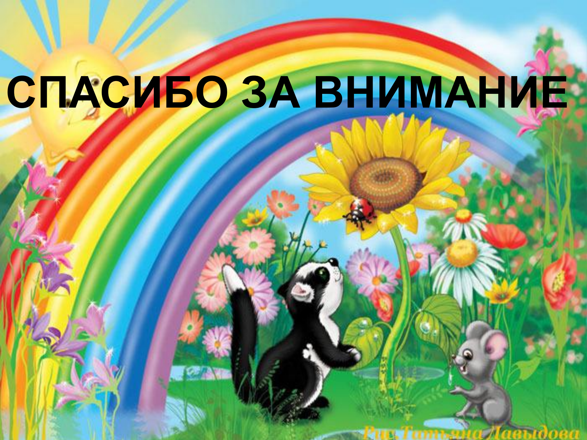
Рис. Татьяна Лавыдова