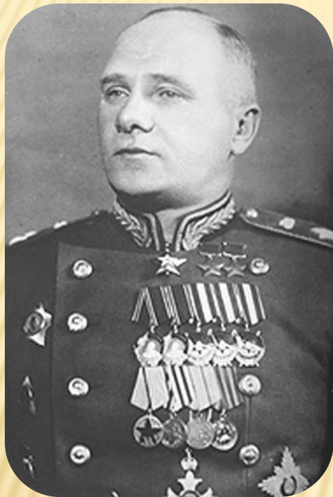
Семен Ильич Богданов (1894-1960) маршал бронетанковых войск, дважды Герой Советского Союза (1944, 1945).