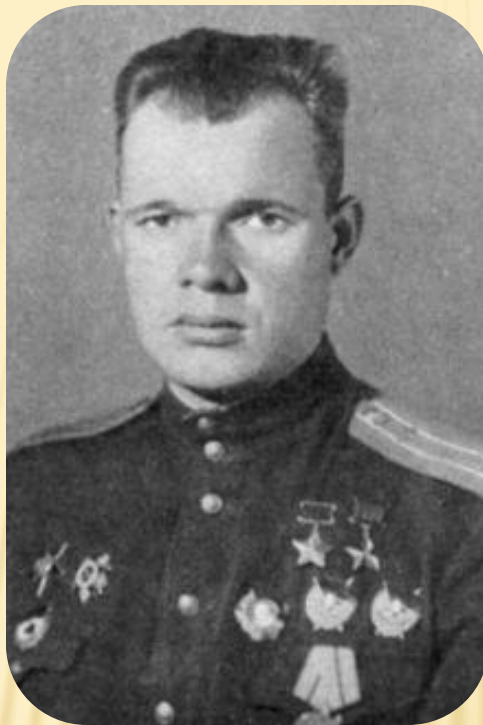
Виктор Максимович Голубев (1915-1945) летчик штурмовой авиации, дважды Герой Советского Союза (1942, 1943)