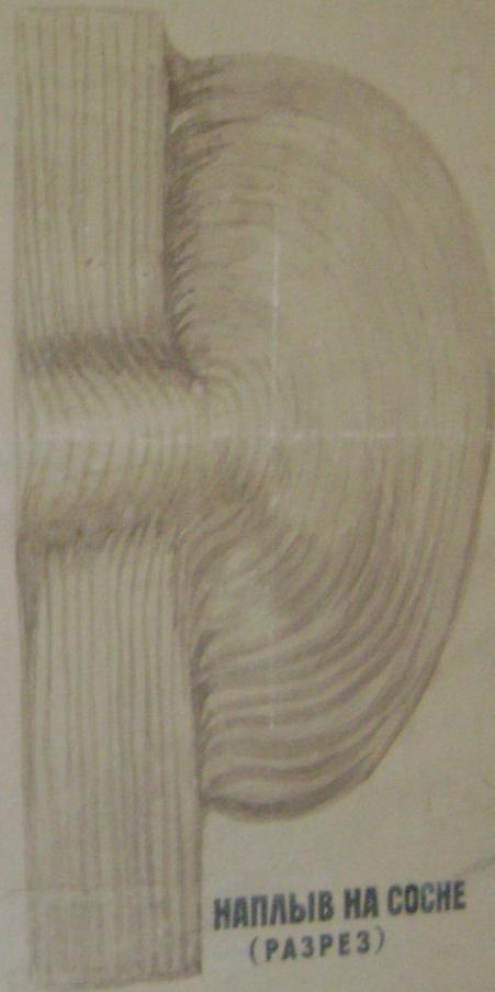
НАПЛЫВ НА СОСНЕ (РАЗРЕЗ)