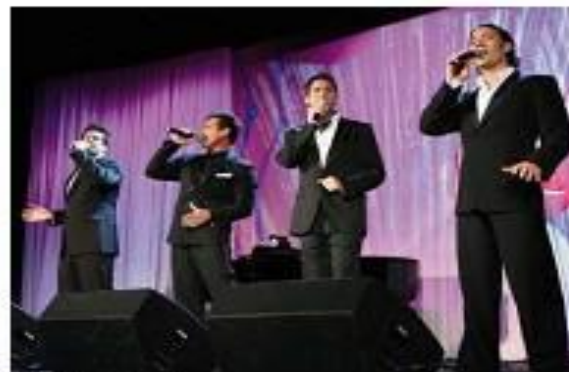
«El Diva». Кларсон «Детская юбка Вилли»