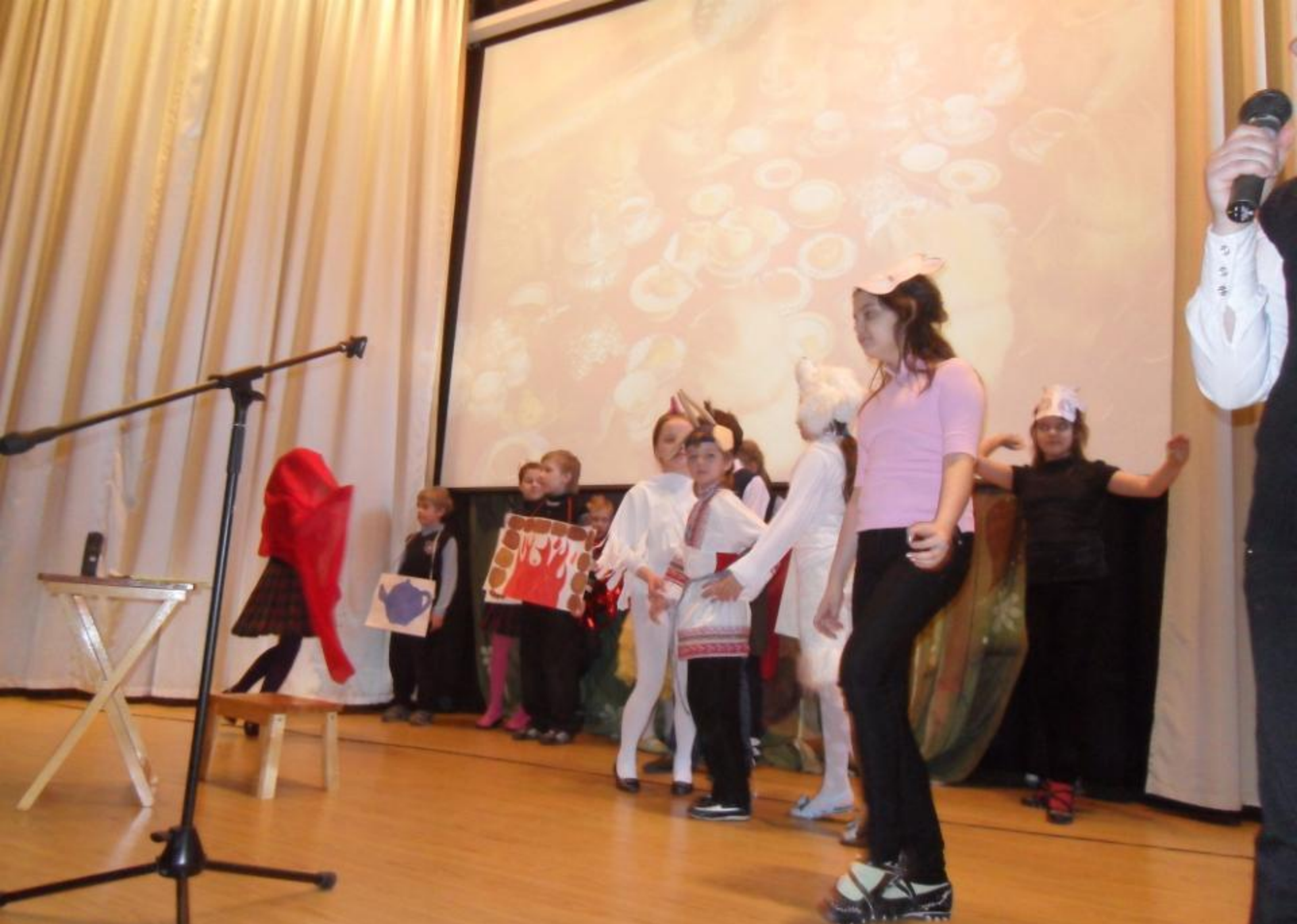
2011 г. – «Школа будущего глазами ребёнка»