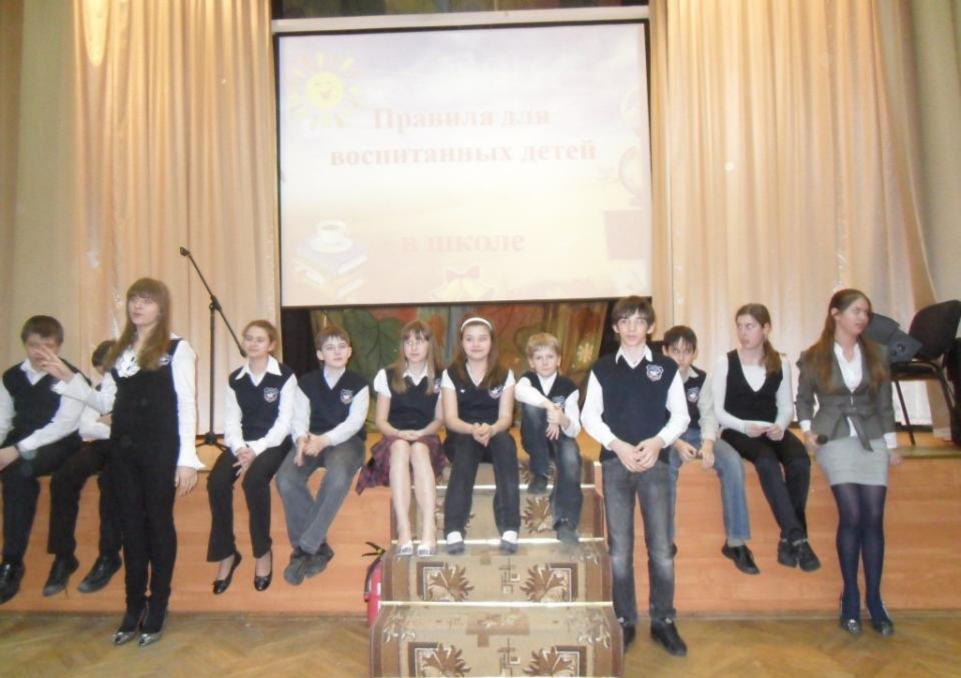
2011 г. – «Школа будущего глазами ребёнка»