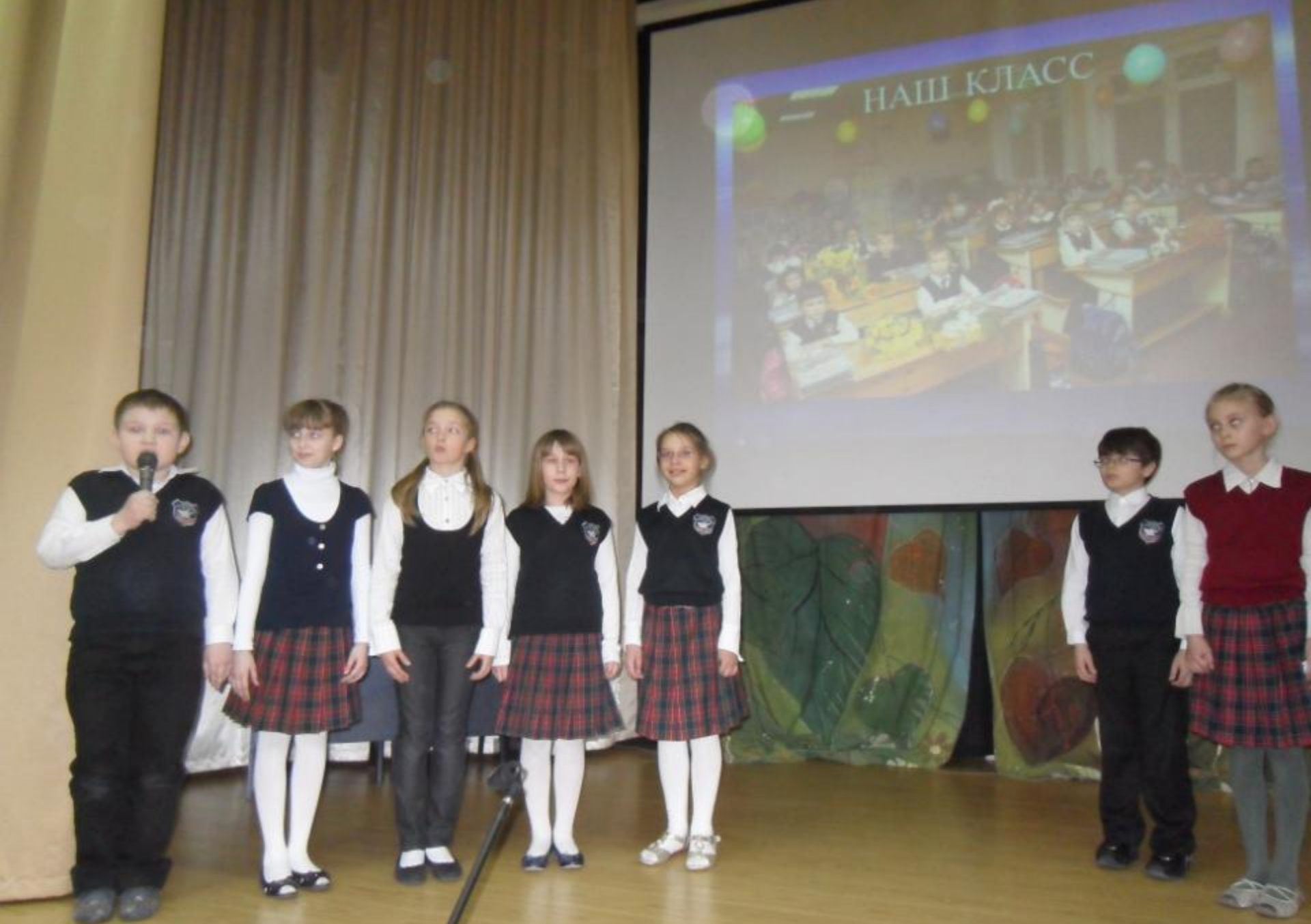
2011 г. – «Школа будущего глазами ребёнка»