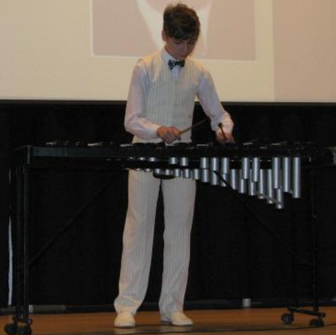
2010 г. – «Шедевры мировой художественной культуры XX века»