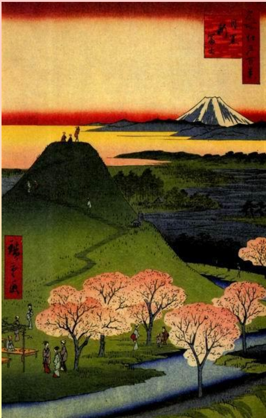
Андо Хиросиге – Мегуро Сан- Фудзи (Новая Фудзияма)