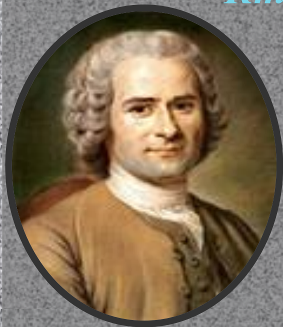
Жан Жак Руссо