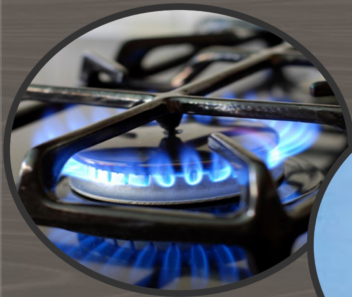
Дым от газовой горелки