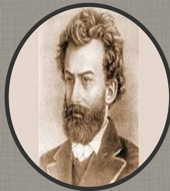
Николай Миклухо - Маклай