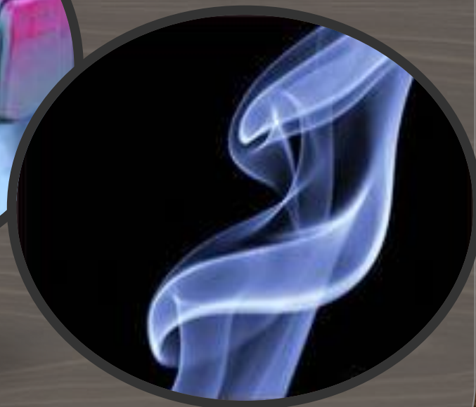
Дым от сигареты