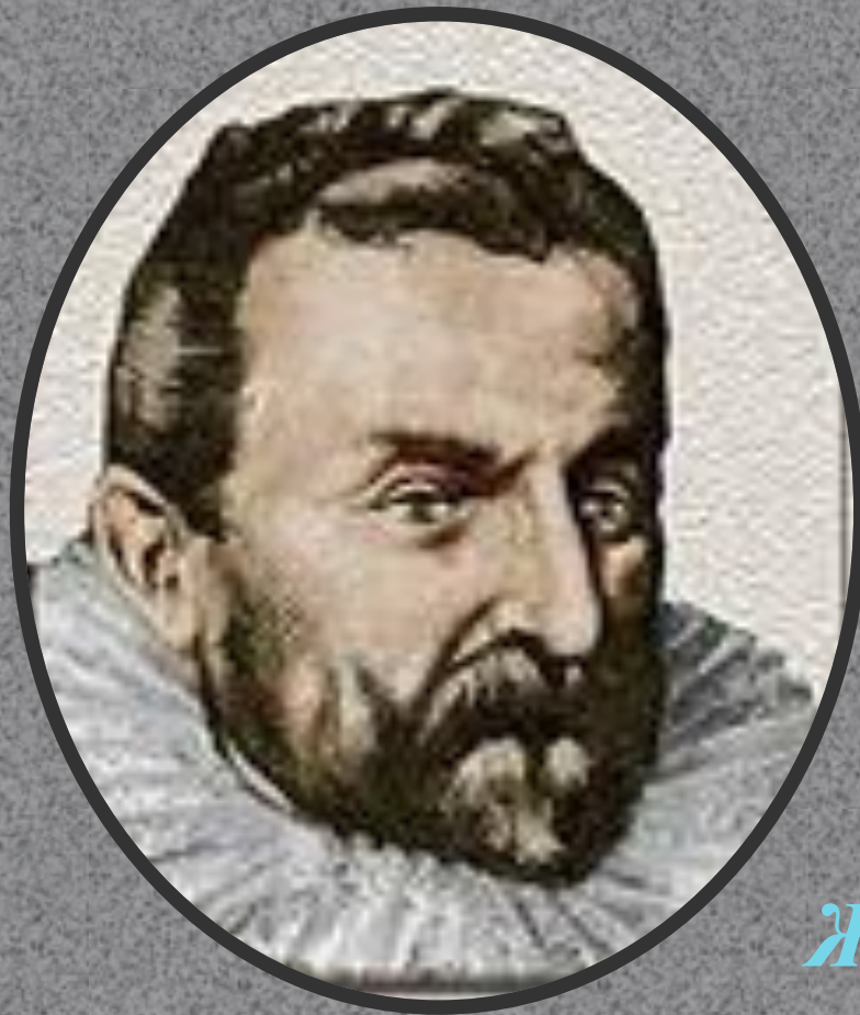
Жан Нико французский дипломат