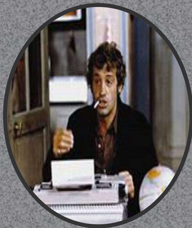
Жан Поль Бельмондо