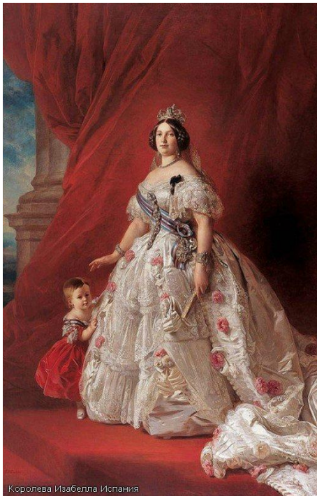
Королева Изабелла Испания

Второе рококо (изящество, легкость, воздушность) отличается от первого подражательностью, тяжеловесностью деталей, отсутствием искренности, чувства новизны, подлинного вдохновения.