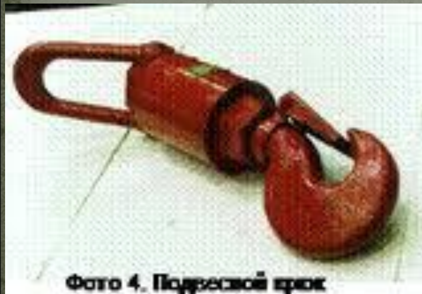
Фото 4. Подъемный крюк

Крюк состоит из рога крюка, подвески и серьги.