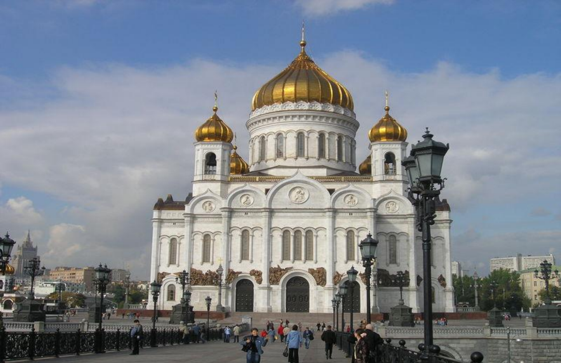
ХРАМ ХРИСТА СПАСИТЕЛЯ НА ВОЛХОНКЕ