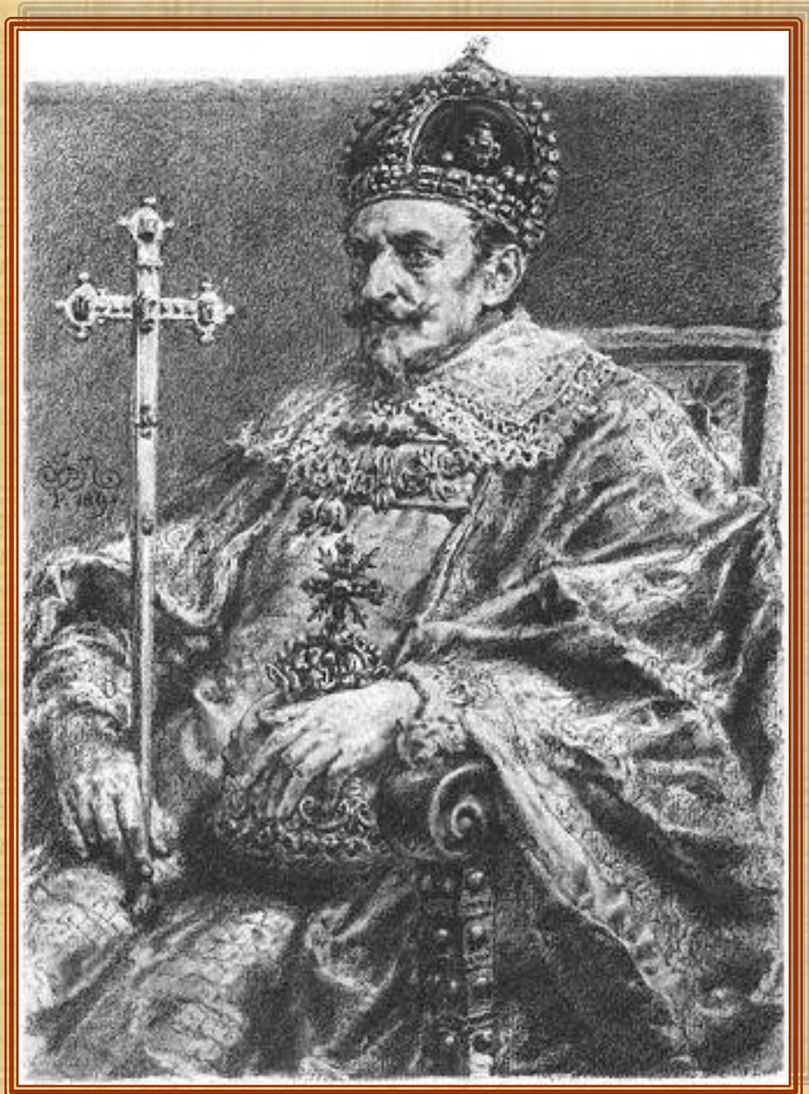
Польский король Сигизмунд III