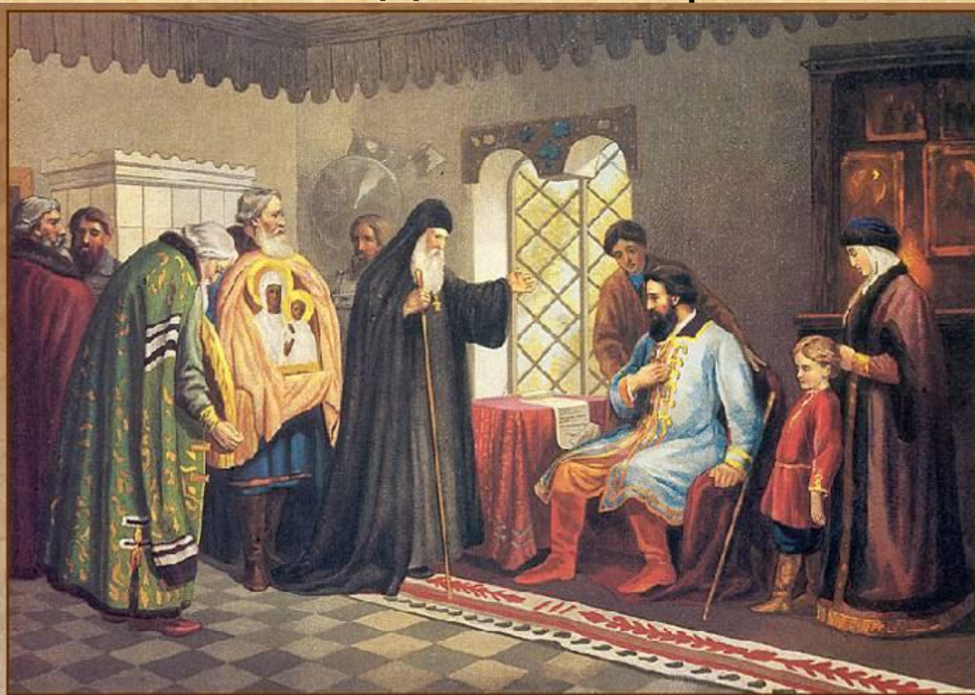
Нижегородские послы у князя Дмитрия Пожарского. 1611 г.

. Военным руководителем ополчения стал князь Д. М. Пожарский.