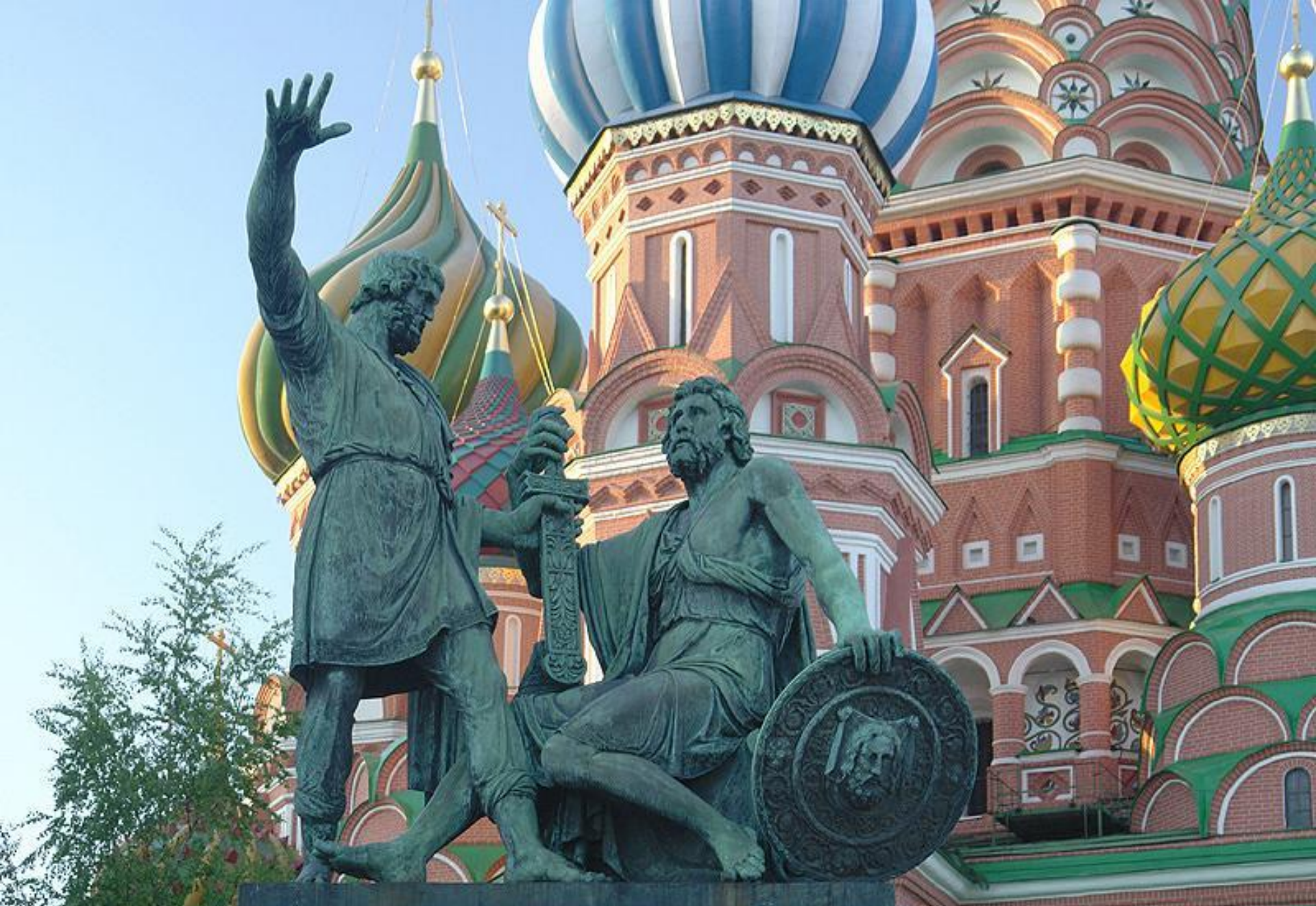
Памятник Минину и Пожарскому