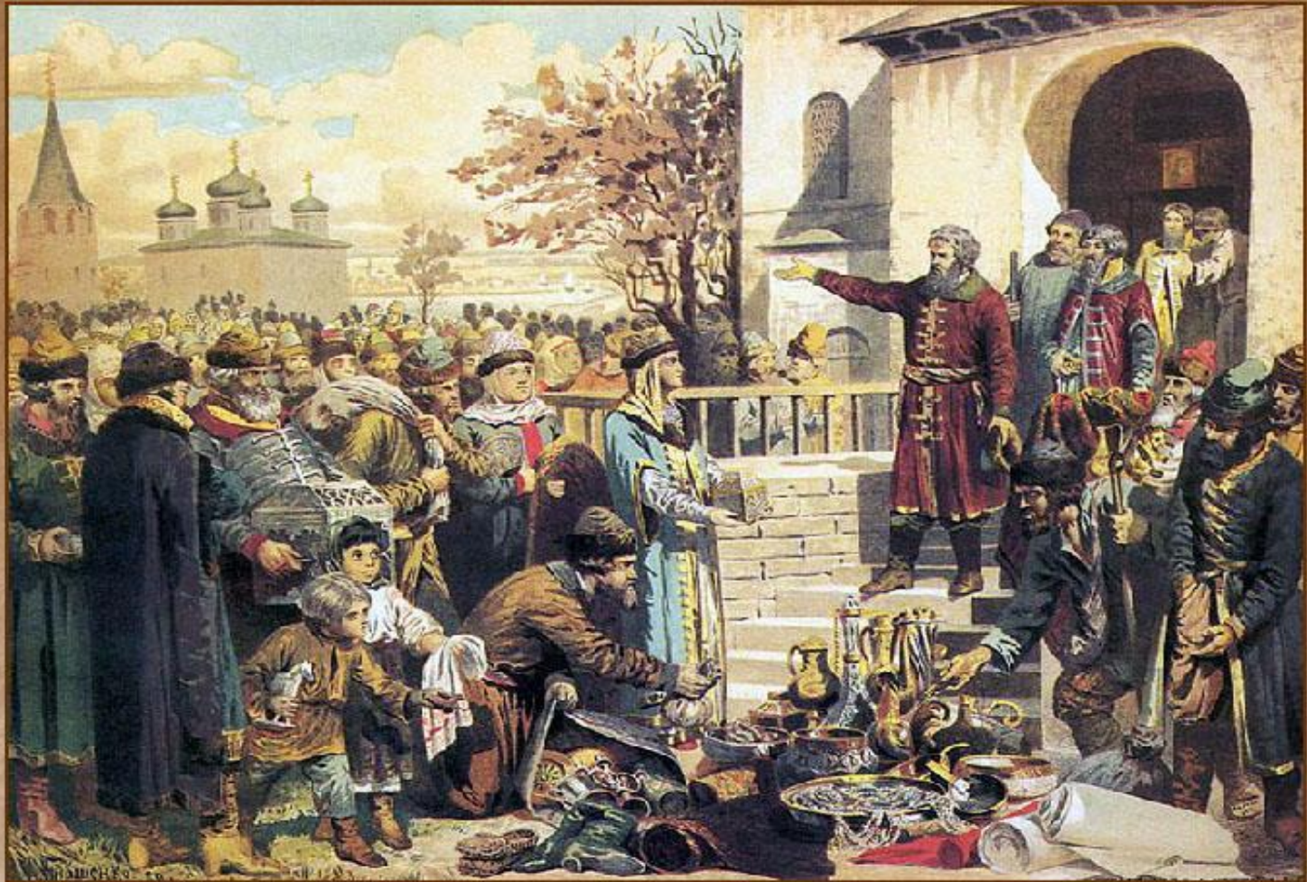
Воззвание Козьмы Минина к нижегородцам

Осенью 1611 г. по призыву нижегородского купеческого старосты К. Минина началось формирование Второго ополчения