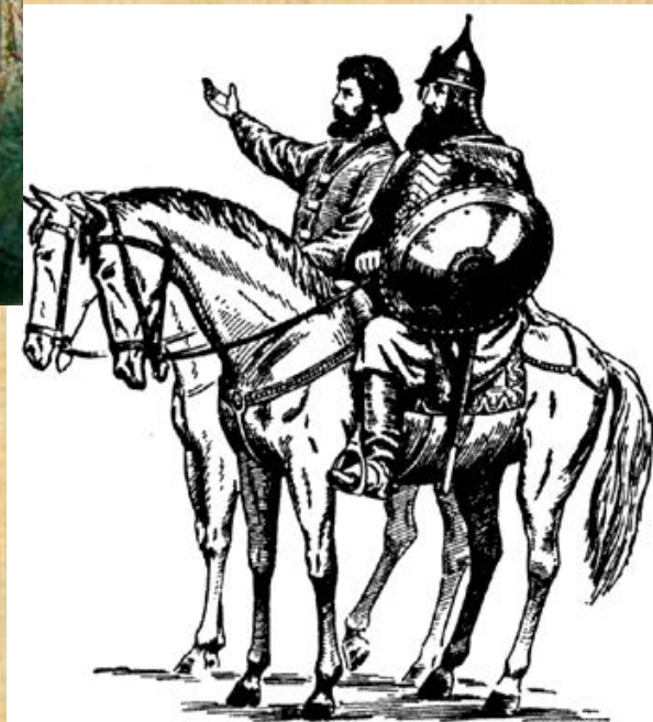
Дмитрий Пожарский и Кузьма Минин