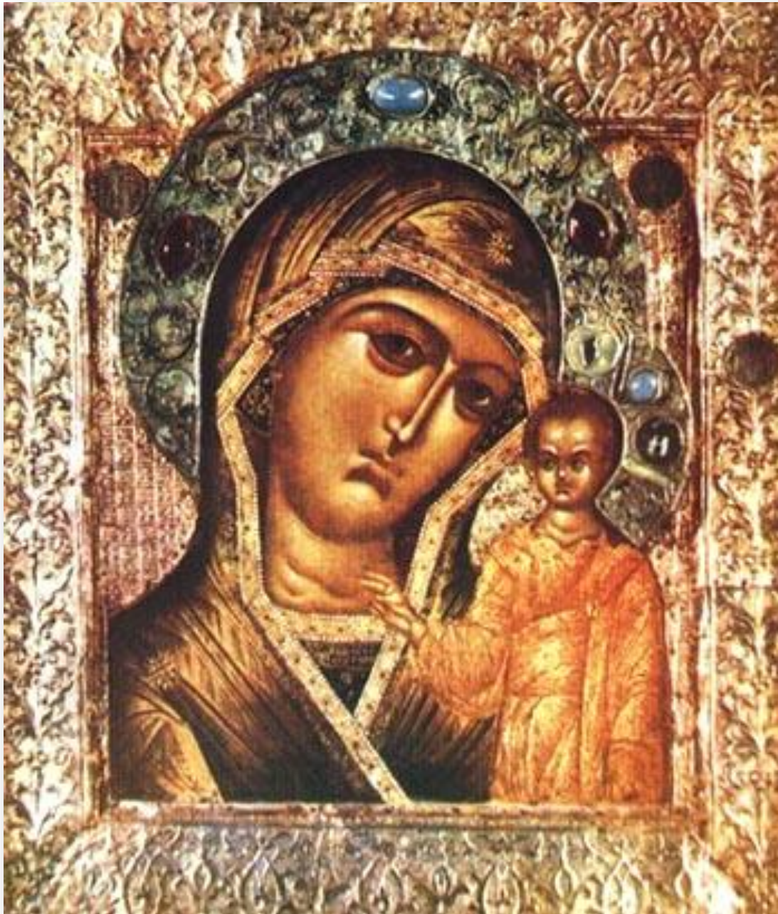
Казанская икона Божией Матери (1612)