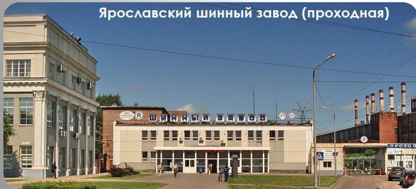
Ярославский шинный завод (проходная)