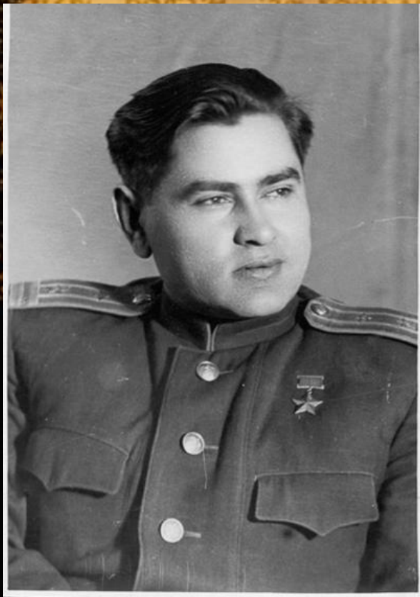
Алексей Петрович Маресьев (1916–2001 г. г.)