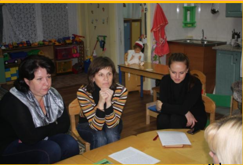
Круглый стол «Какие сказки мы рассказываем детям»