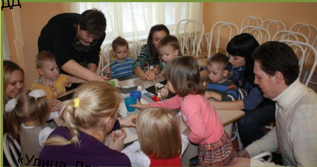
«Улица. Дорога. Светофор»