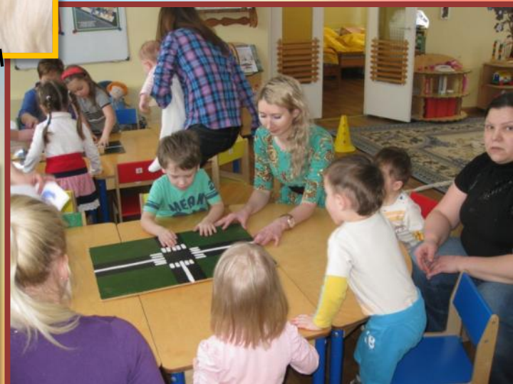
«Неразлучные друзья – взрослые и дети»