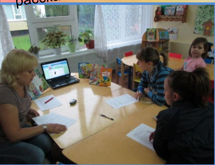
Консультация по ПДД