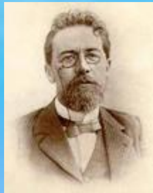
А.П.Чехов (1860 – 1904)

«В человеке все должно быть прекрасным – и душа, и тело, и мысли».