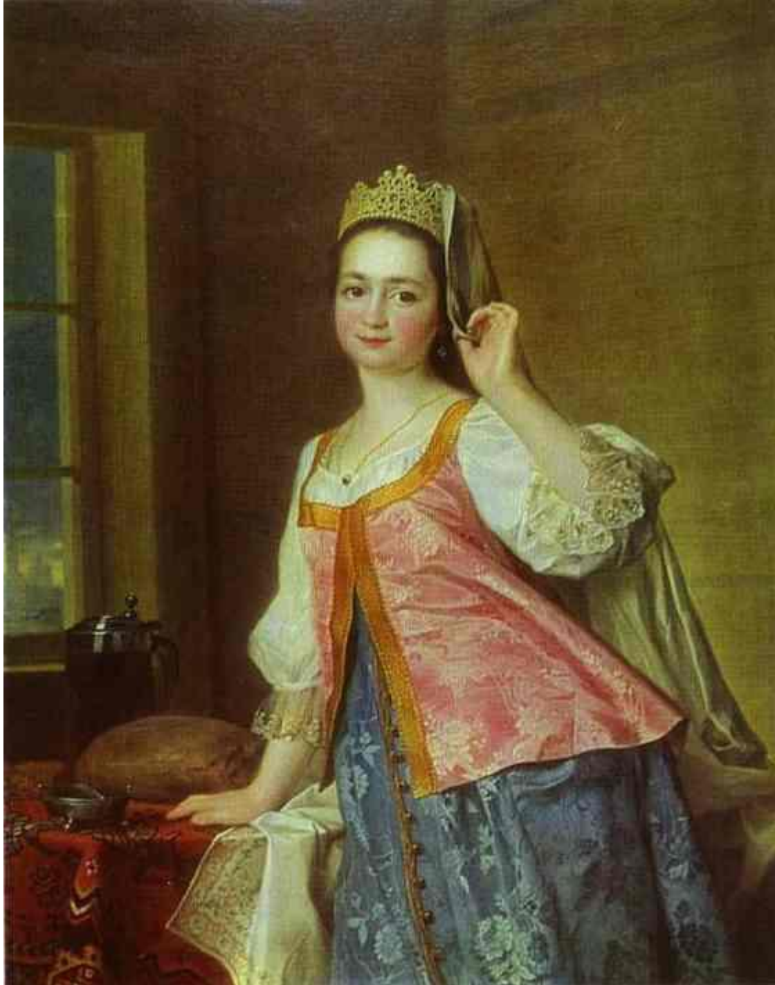
ЛЕВИЦКИЙ Д МИТРИЙ ГРИГОРЬЕВИЧ (ПОРТРЕТ АГАШИ ЛЕВИЦКОЙ)