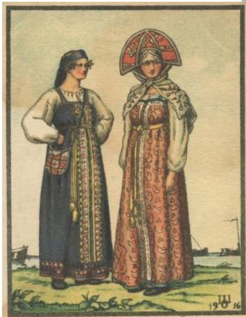
Калужская 2. Народная женская одежда. ВЕЛИКОРОССЫ Шулььской и Калужской губерний.