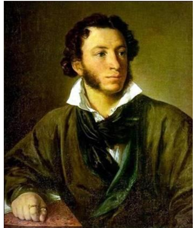
Василий Тропинин Портрет А.С. Пушкина