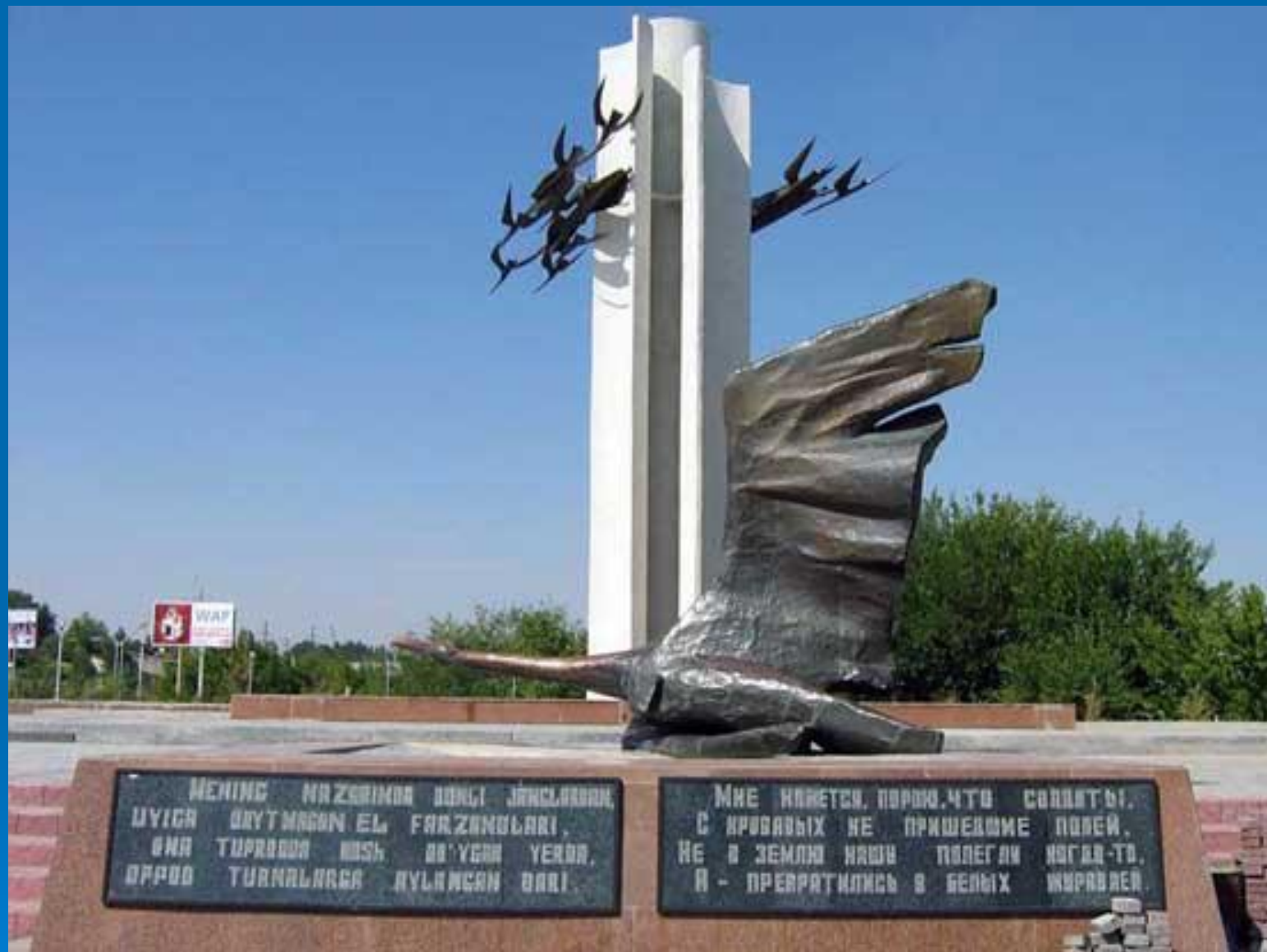
Город Чирчик, Узбекистан