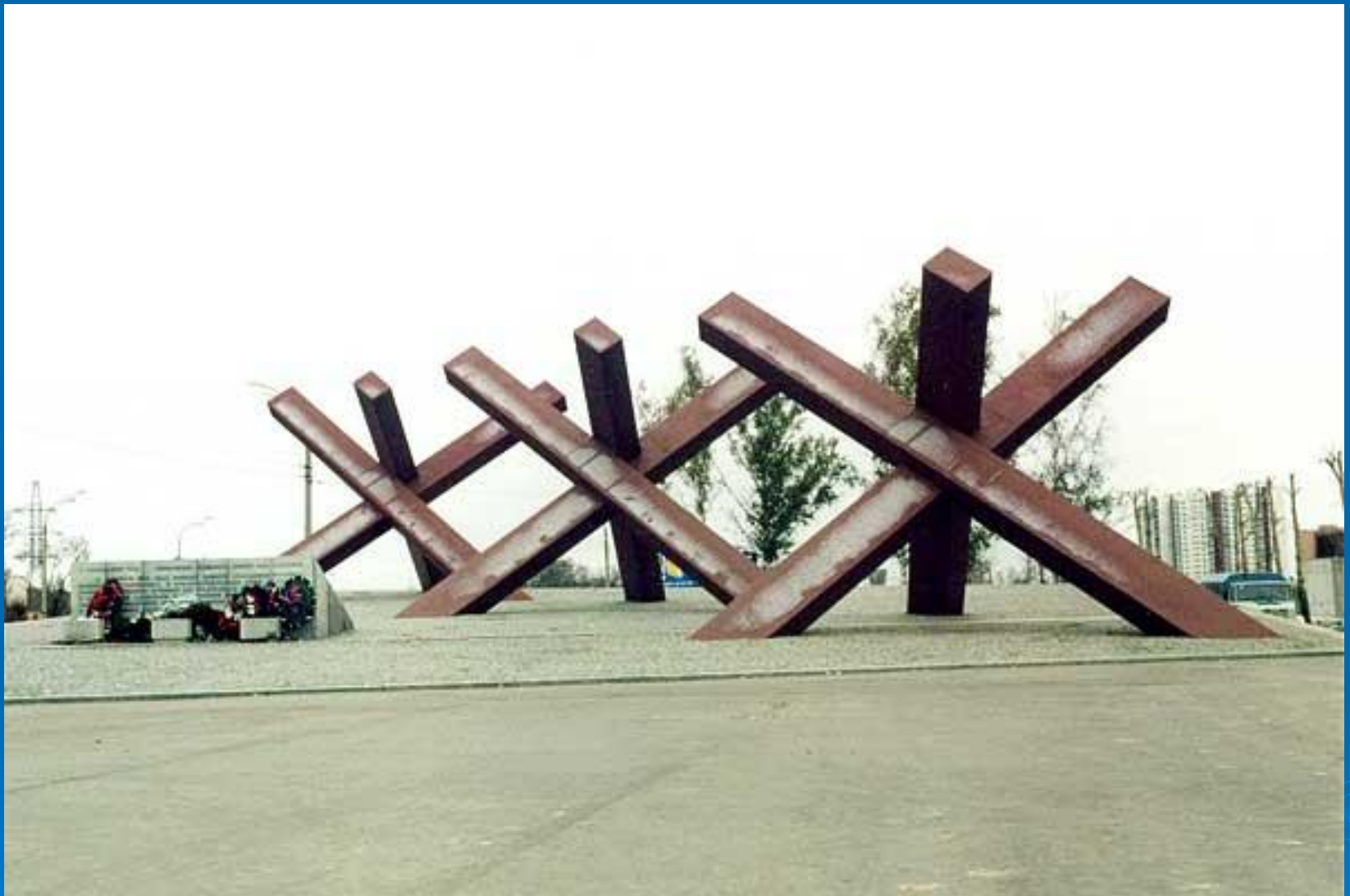
Памятник защитникам Москвы