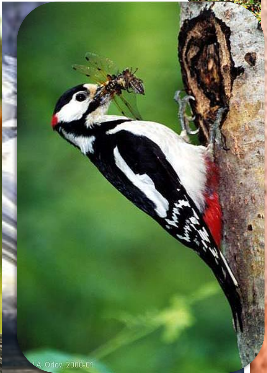
I. A. Orlov, 2000-01