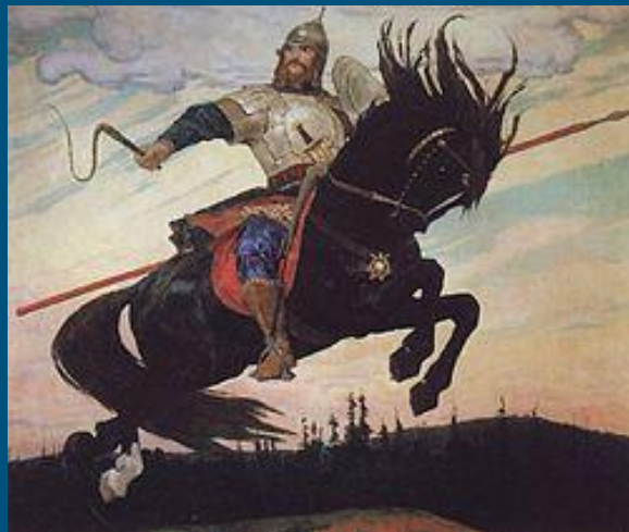
“Богатырский скак” М.В.Васнецов