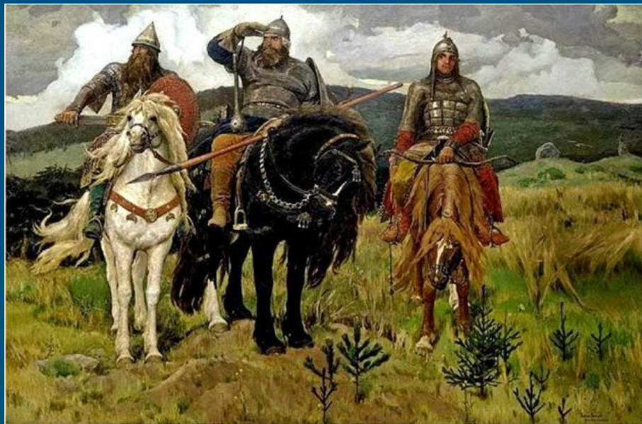
В.М.Васнецов “Три богатыря”

Изображение не всей древнерусской дружины, а отдельных воинов богатырей, побеждающих несметное полчище врагов