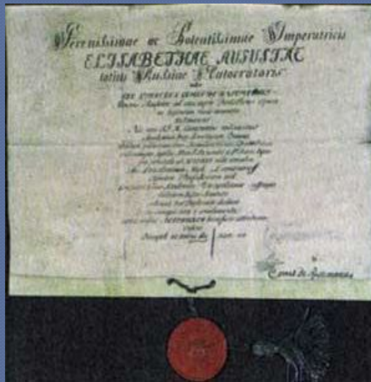
Диплом на звание профессора химии

Одним из первых важных начинаний химика явилась постройка в 1748 г. химической лаборатории Академии наук на Васильевском острове. Она стала первым в истории России исследовательским учреждением.