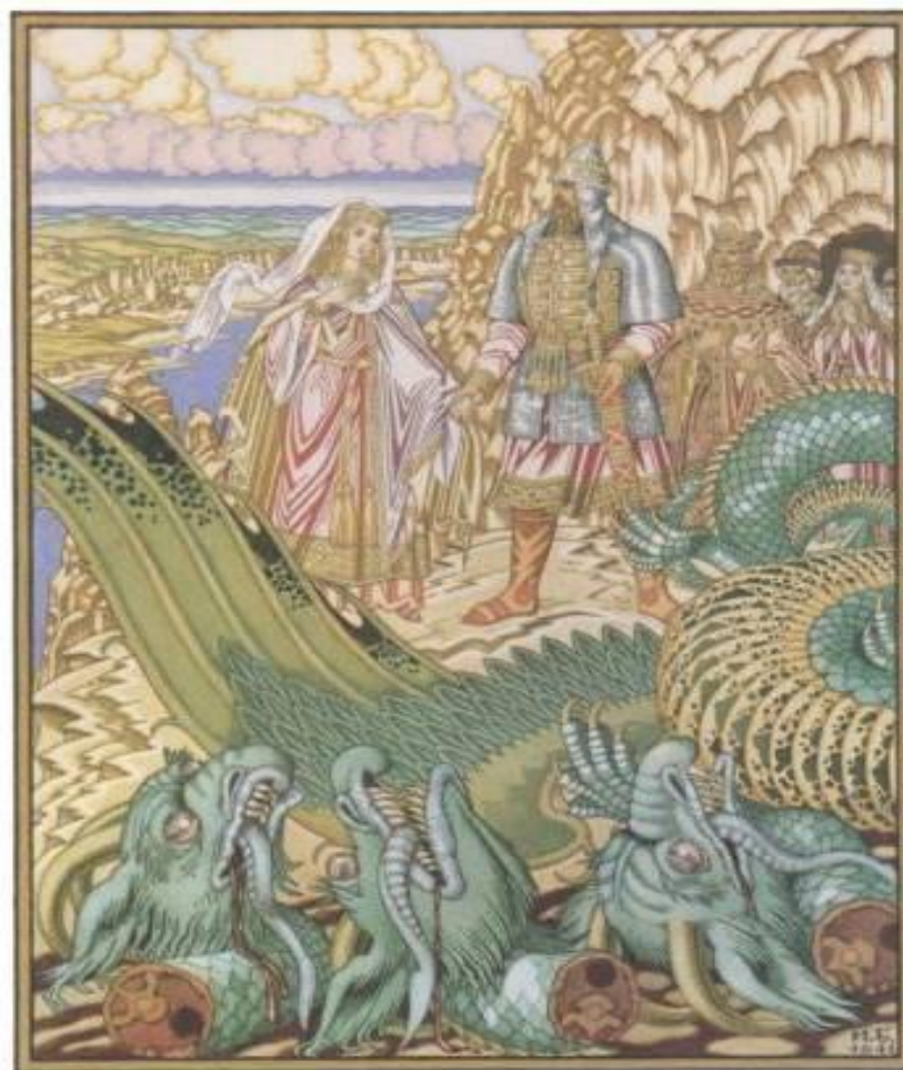
177 ДОБРЫНЯ НИКИТИЧ ОСВОБОЖДАЕТ ОТ ЗМЕЯ ГОРЫНЫЧА ЗАБАВУ ПУТЯТИСНУ. Иллюстрация к былинке. 1941