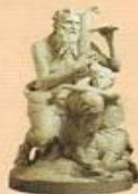
П. Великовский Бог