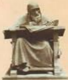
М. Актовольский Нестор-летописец