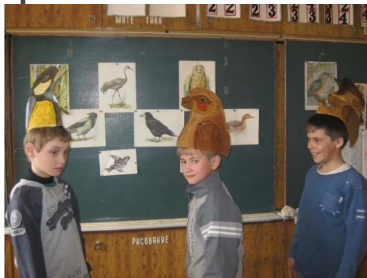
Сценка «Птичий разговор»