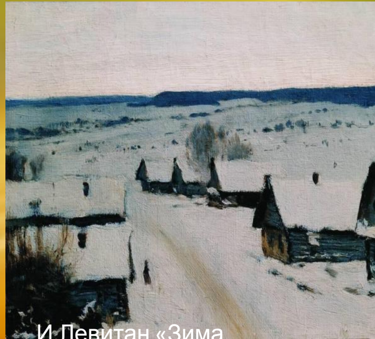
И.Левитан «Зима. Деревенька»