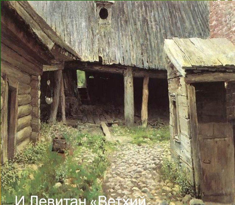
И.Левитан «Ветхий дворик»