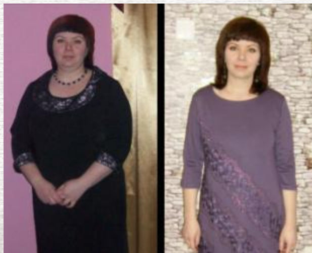
Рациональное правильное питание