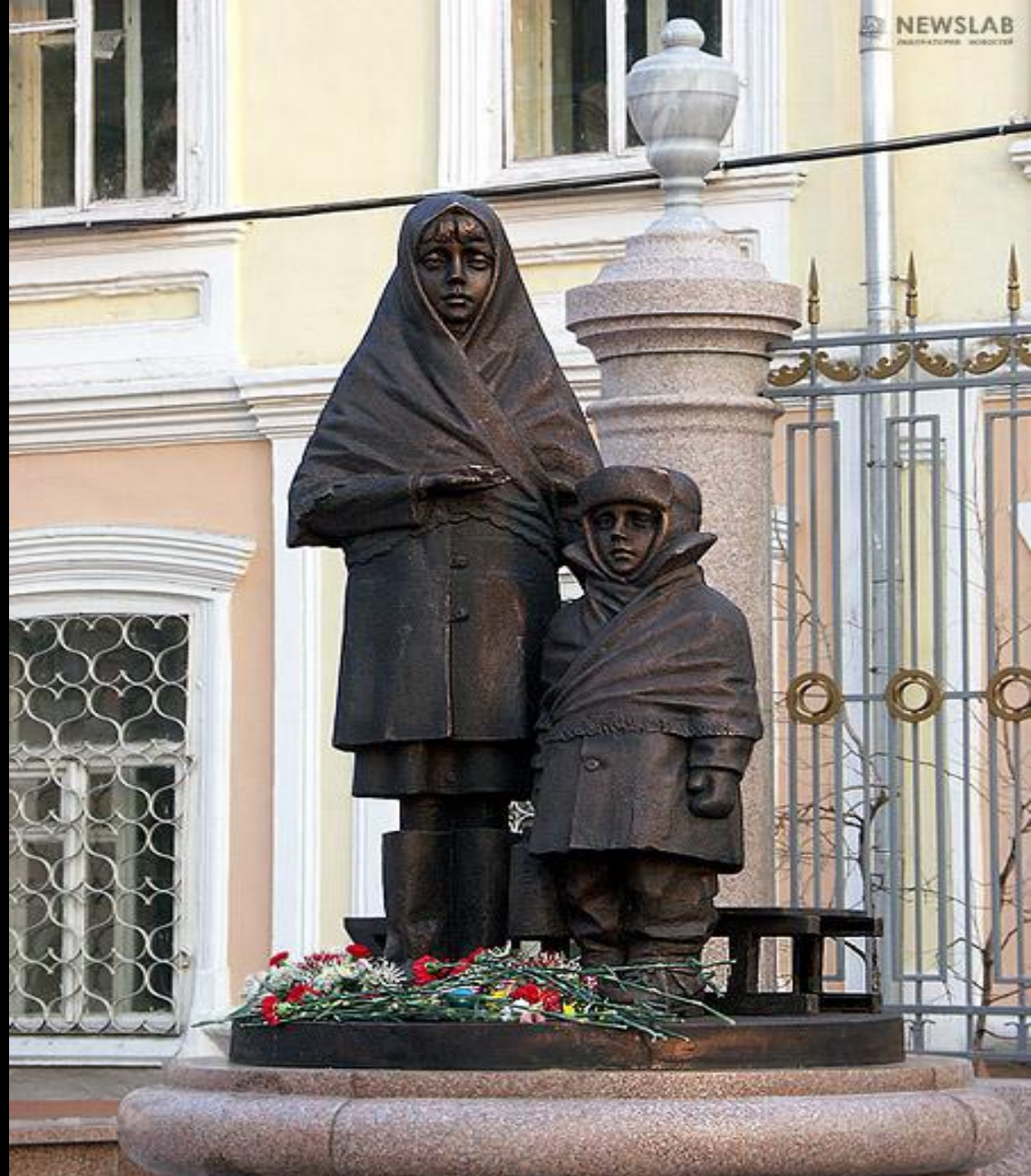
Памятник детям блокадного Ленинграда