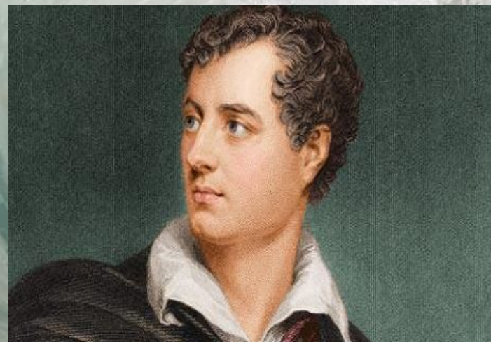
Д.Г. Байрон 1788-1824