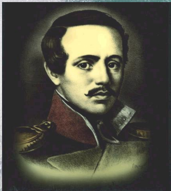
М.Ю. Лермонтов 1814-1841

Мне нужно действовать, я каждый день Бессмертным сделать бы желал, как тень Великого героя...