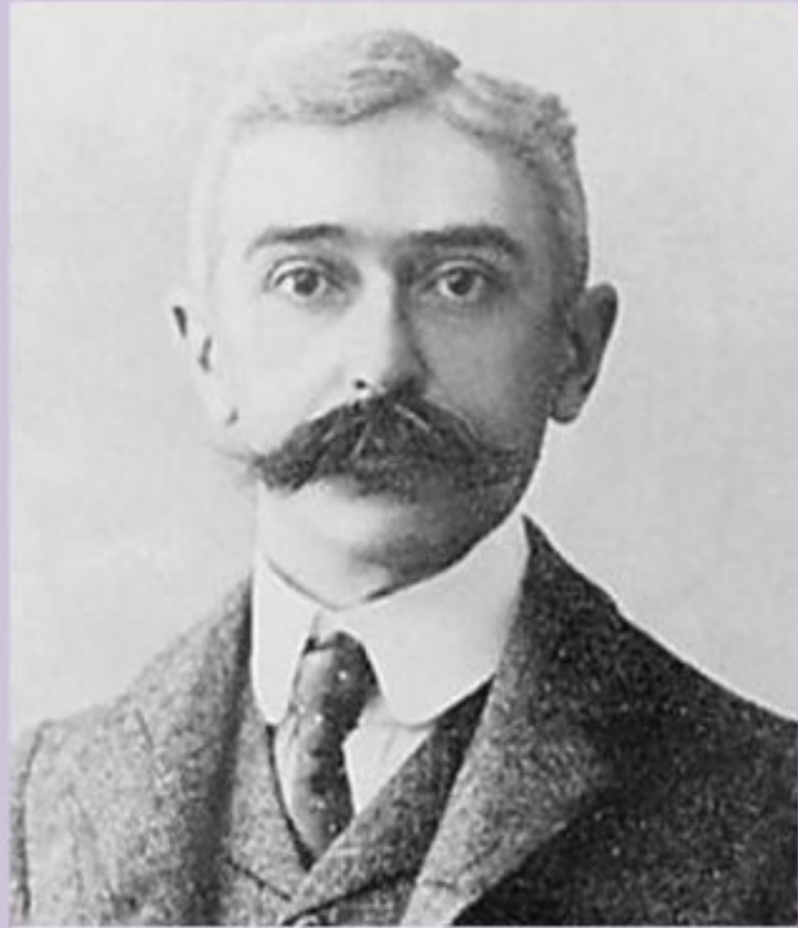
Пьер де Кубертен

25 ноября 1892 года де Кубертен выступил в Сорбонне с докладом "Возрождение олимпизма", совпавшим по времени с раскопками в древней Олимпии. 23 июня 1894 года в Париже было принято историческое решение о возобновлении Олимпийских игр, которые следует проводить каждые четыре года — как и в Древней Греции.