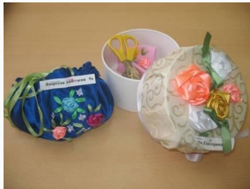
Вышивка шелковыми ленточками