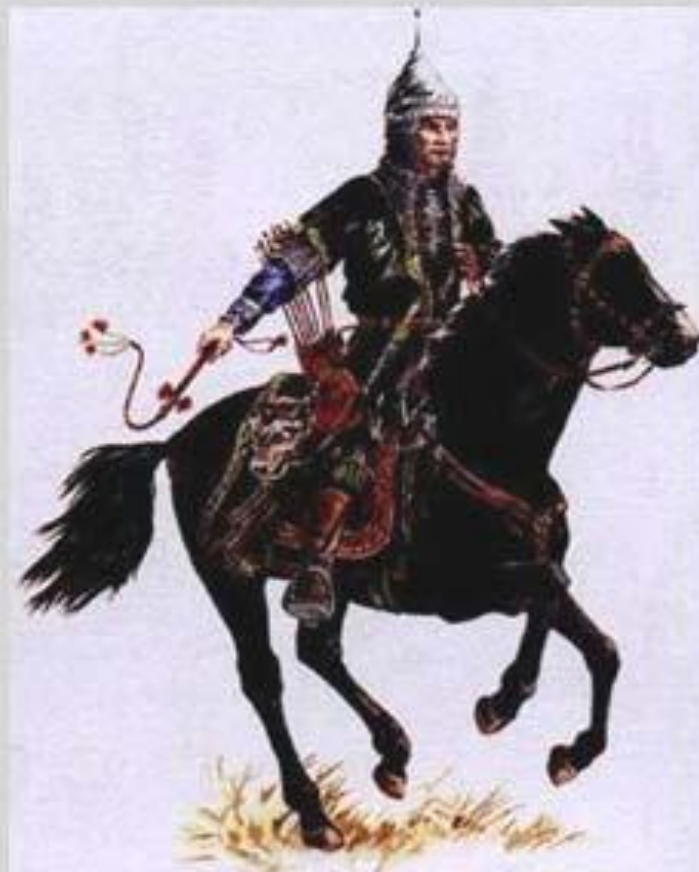
Опричник. XVI век