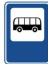
Место остановки автобуса и (или) троллейбуса