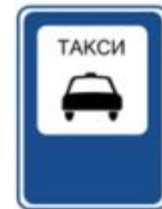
Место стоянки легковых такси