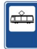
Место остановки трамвая