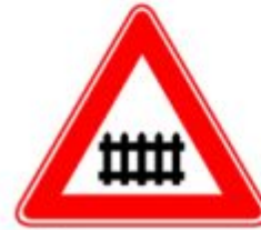
Железнодорожный переезд со шлагбаумом