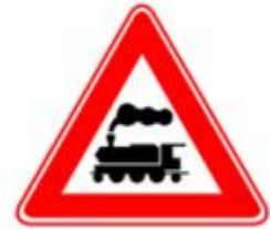
Железнодорожный переезд без шлагбаума