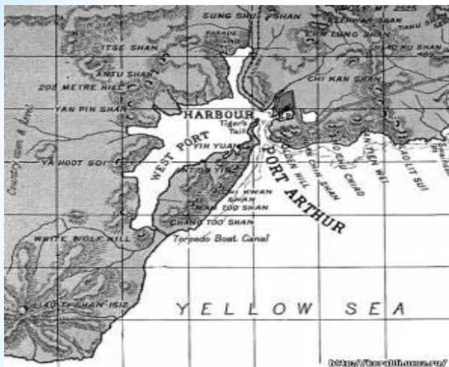
Порт-Артур на карте