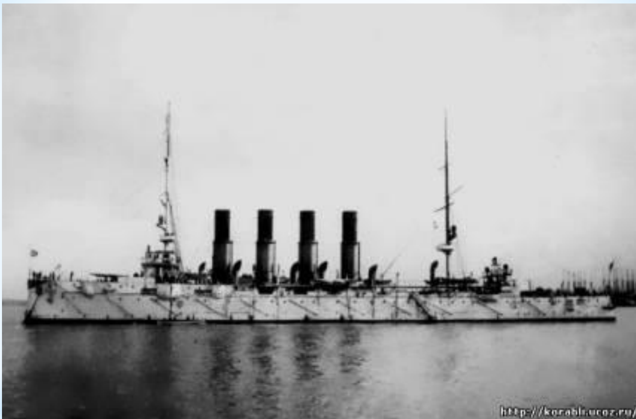
«Варяг» в Филадельфии перед выходом в Россию