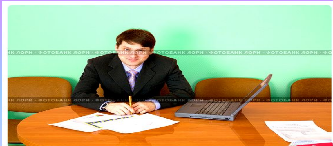
Мужчина в деловом костюме за рабочим столом в офисе